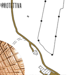
PROGETTO DEL LEWIS CENTER FOR THE ARTS PRINCETON UNIVERSITY NEW JERSEY, USA 2007-2017 STEVEN HOLL ARCHITECTS