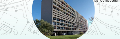
PROGETTO DI UN EDIFICIO CIVILE L'UNITE' D'HABITATION DE MARSEILLE CITTÀ DI MARSIGLIA, FR 1947 LE CORBUSIER