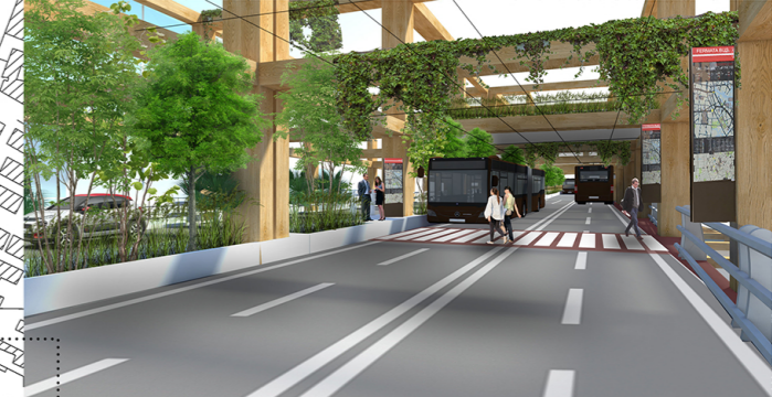
RENDER VISTA ESTERNA SOSTA BUS