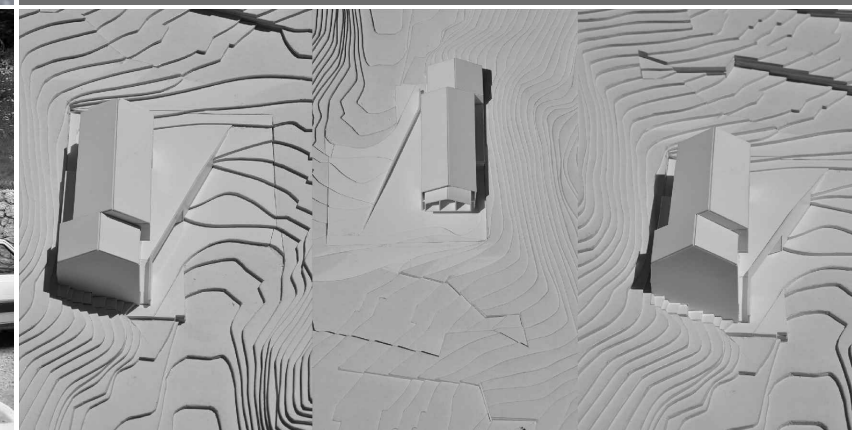
VALLESINELLA HOTEL madonna di campiglio (Tn)