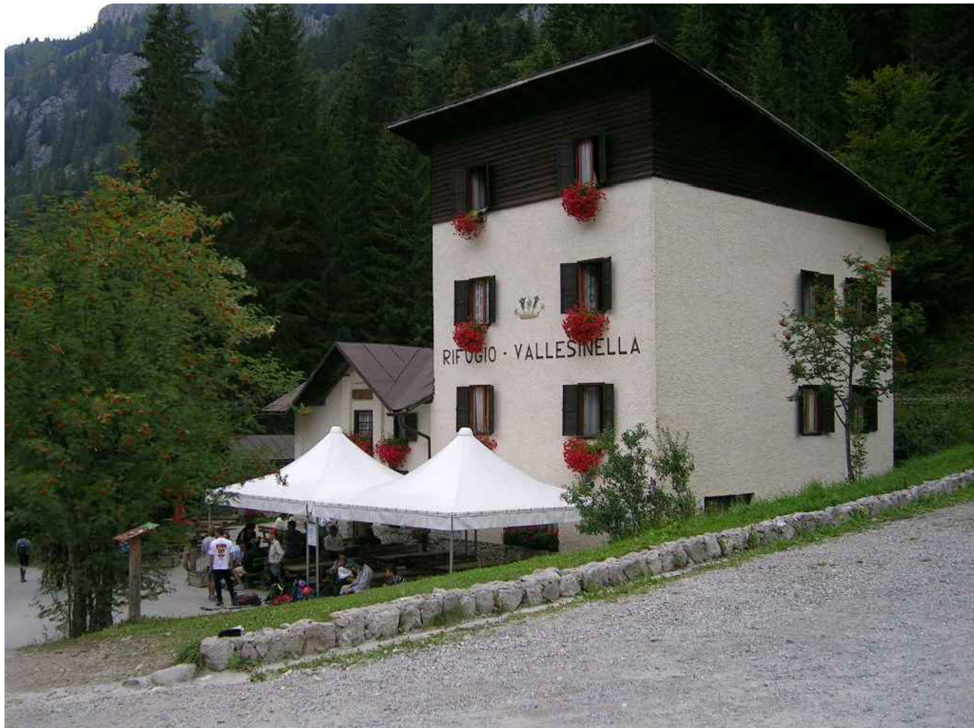
Vallesinella Hotel_ Madonna di Campiglio TN

L'albergo, 20 posti letto, con ristorante e bar è stato realizzato, in sostituzione di un edificio esistente, in un'ampia radura ai piedi delle vette del Gruppo di Brenta, all'interno del Parco Naturale Adamello Brenta.