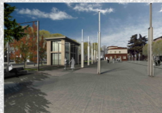
VISTA DAL MONUMENTO