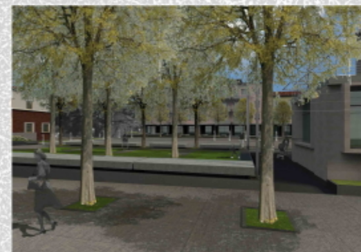
VISTA DA VIALE LIBERTÀ