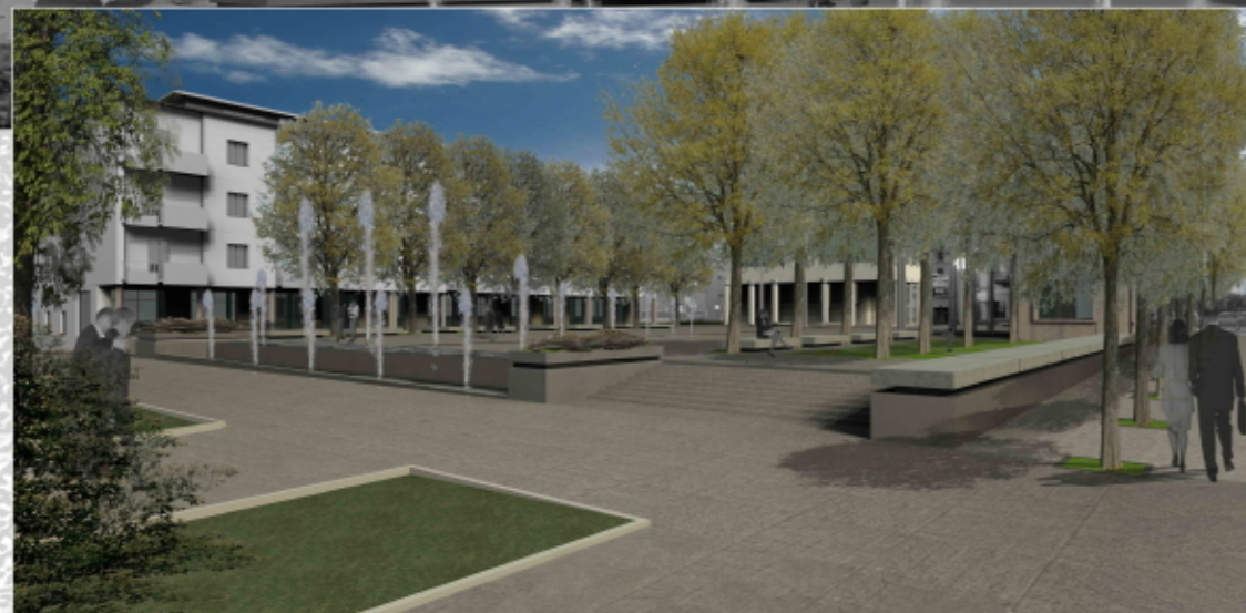
VISTA DELLA PIAZZA DAL MUNICIPIO