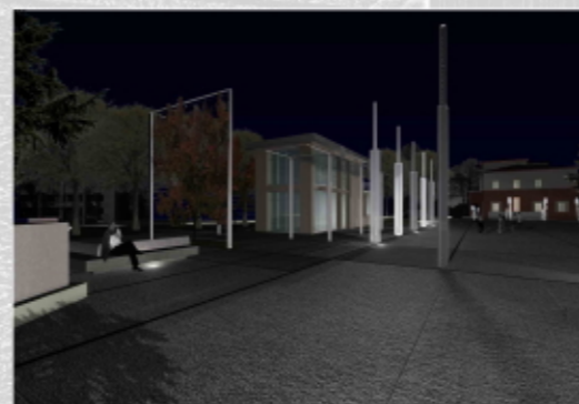
VISTA NOTTURNA DAL MONUMENTO