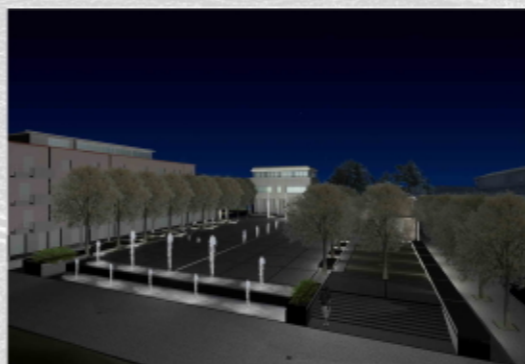
VISTA NOTTURNA DELLA PIAZZA