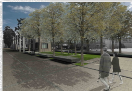
VISTA DEL GIARDINO ALBERATO