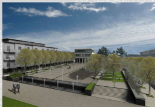
VISTA DELLA PIAZZA DALL'ALTO