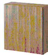
IKEA Besta Nogal Gris 60x20x64cm MADERA NOGAL