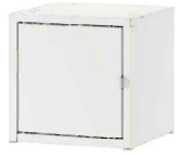
IKEA Lixhult Rosa 25x25cm BLANCO