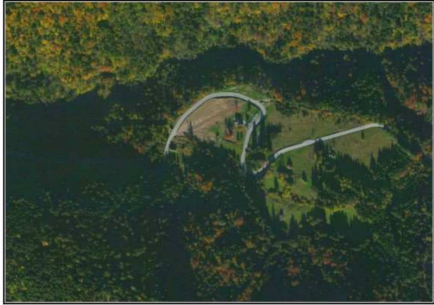
TAV.1 - PLANIMETRIA GENERALE VIABILITA'