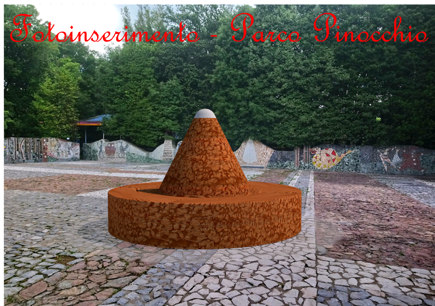
Fotoinserimento - Parco Pinocchio