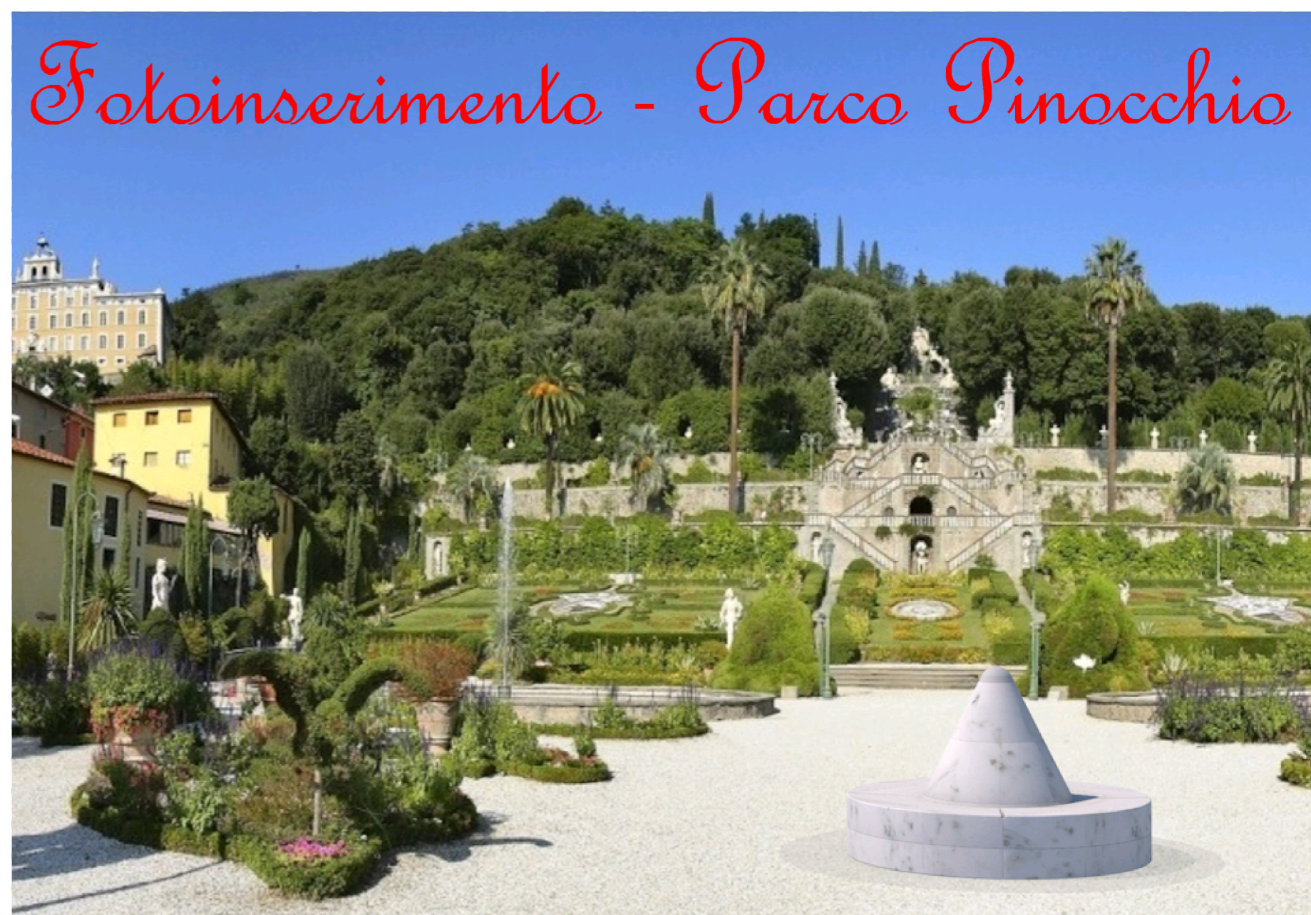
Fotoinserimento - Parco Pinocchio