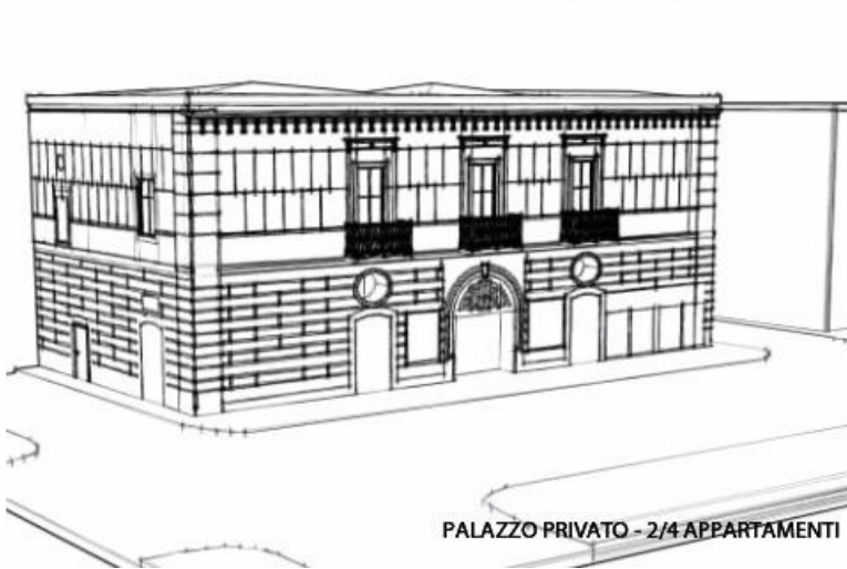
PALAZZO PRIVATO - 2/4 APPARTAMENTI