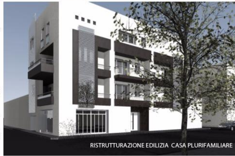
RISTRUTTURAZIONE EDILIZIA CASA PLURIFAMILIARE