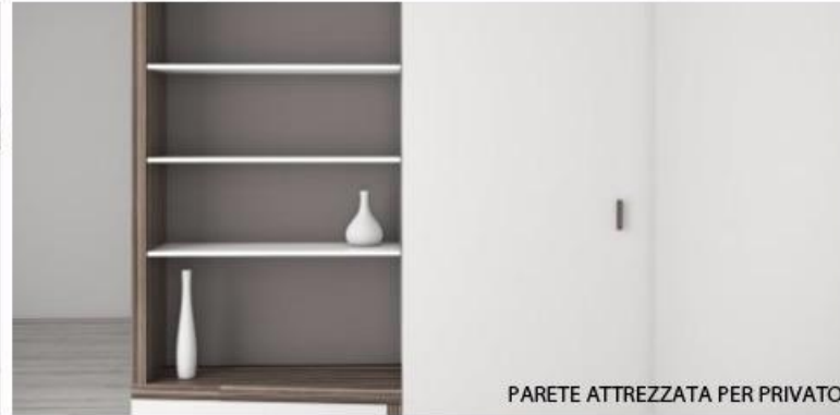
PARETE ATTEZZATA PER PRIVATO