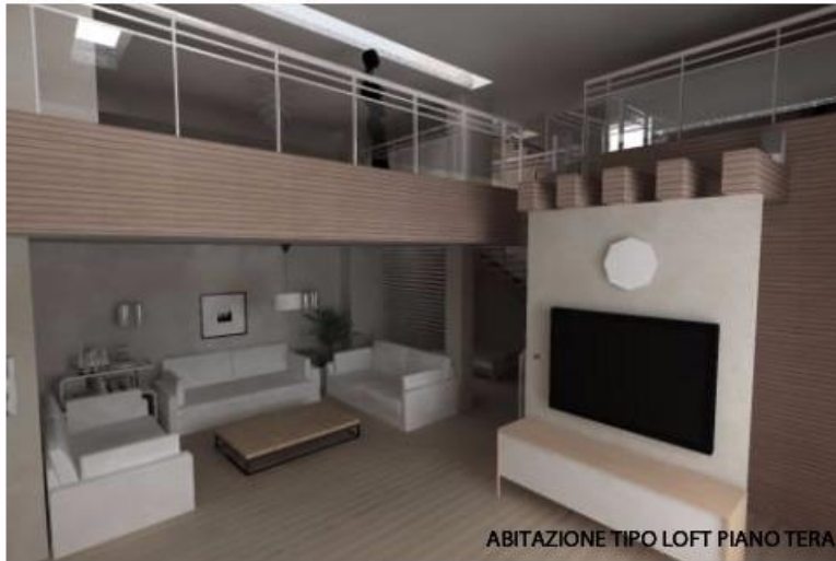
ABITAZIONE TIPO LOFT PIANO TERA