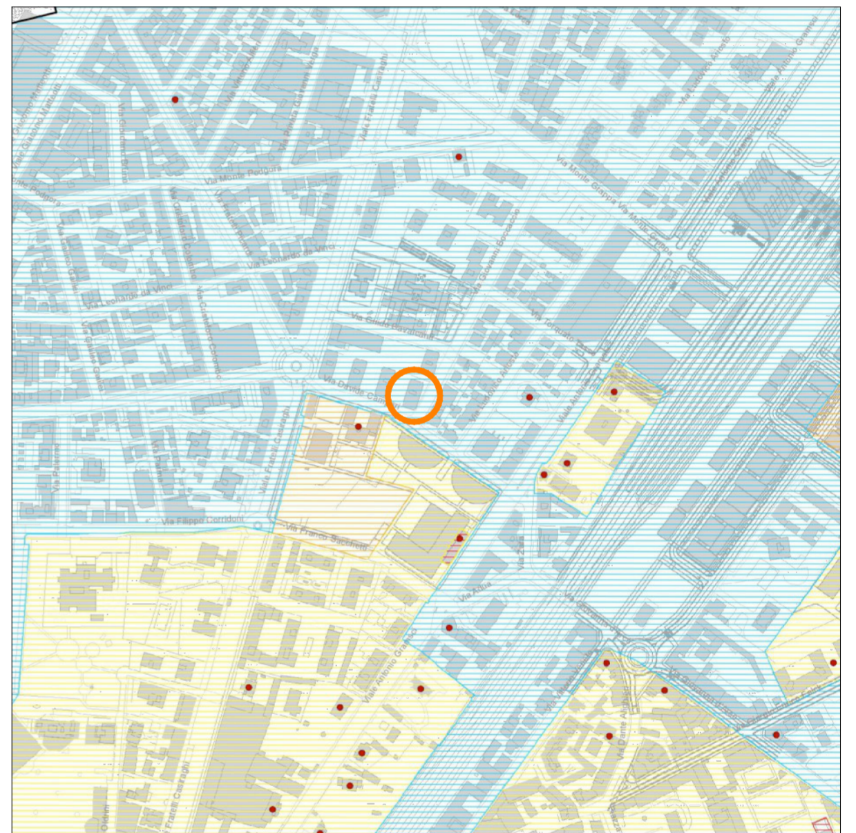
PGT estratto tav. CP04 - scala 1:5000