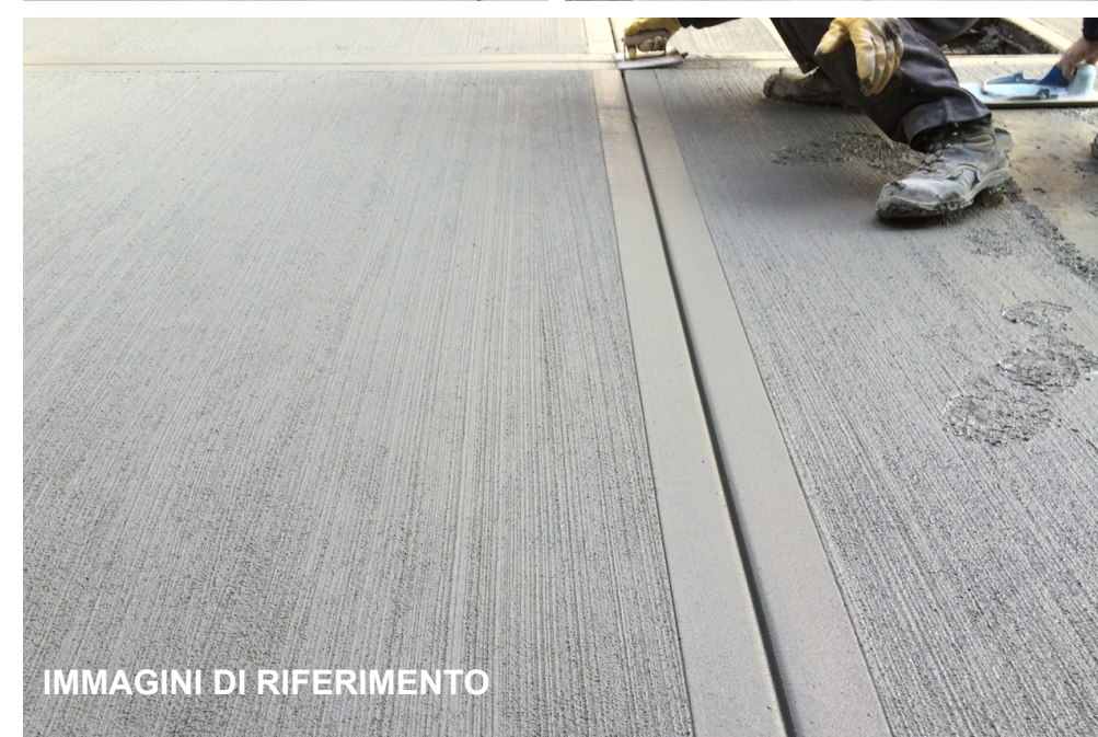
IMMAGINI DI RIFERIMENTO