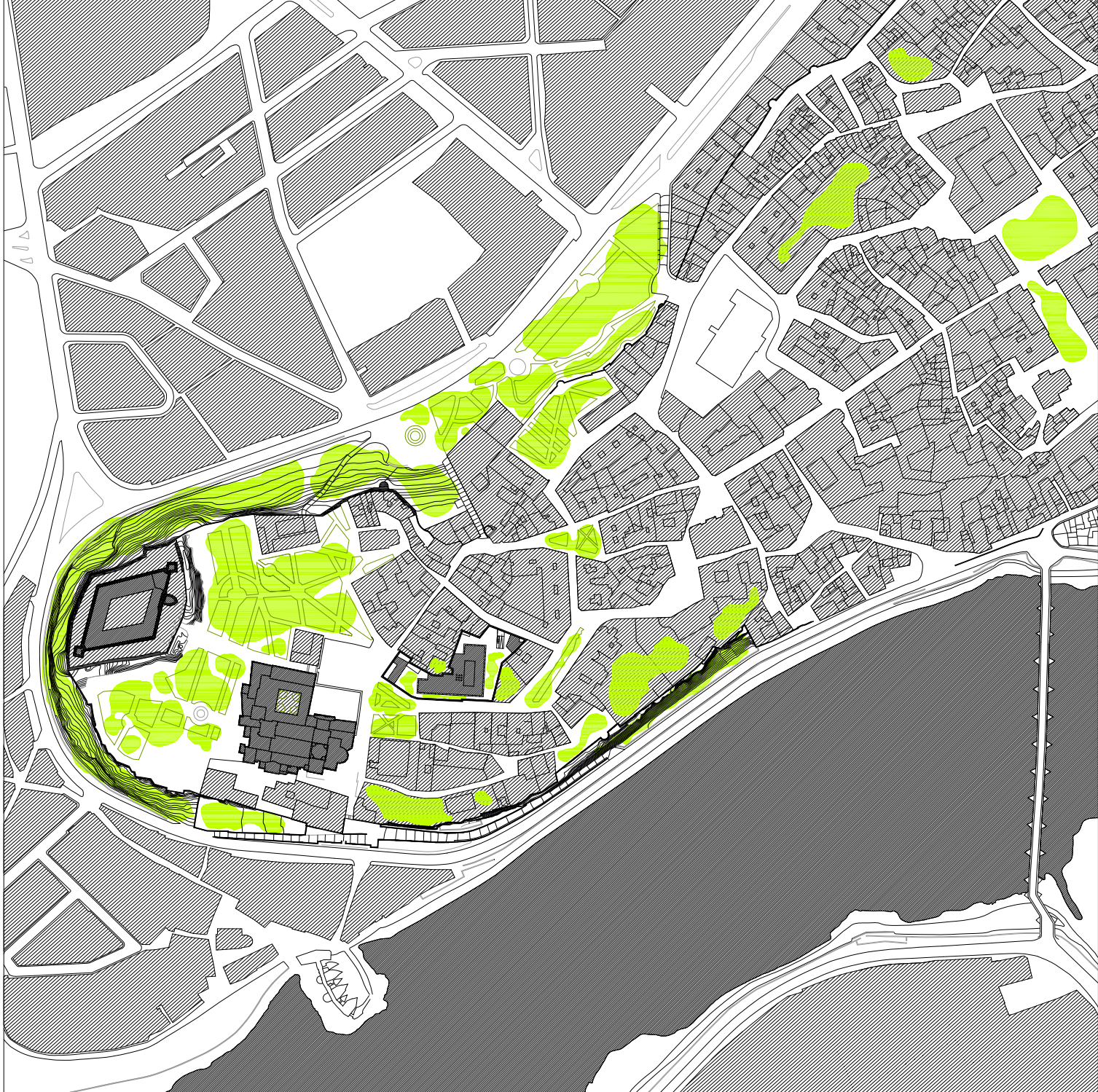
CENTRO HISTÓRICO DE ZAMORA