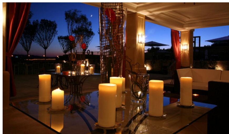
Referencia de decoración

La constante búsqueda de la relajación a través del ambiente es la básica esencia de este bar, con un estilo que divaga por la amplia historia de la subcultura chill out, Para este objetivo hemos decidido disfrazar con textiles la arquitectura geométrica y punzante del anterior Mini club, logrando con esto distorsionar los volúmenes puros y lograr la suavidad necesaria para conseguir el desahogo del estrés en los usuarios. La disposición y diseño con los textiles igualmente se nutren para su tensión y disposición del ambiente playero del lugar, basándose en las velas de los barcos, las olas del mar y las huellas del viento sobre la arena.