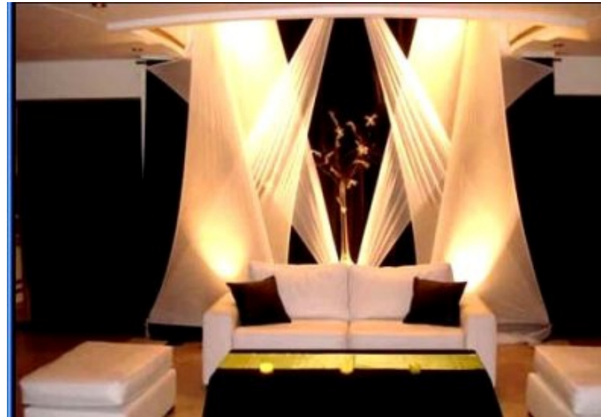
Referencia de ambientación interior