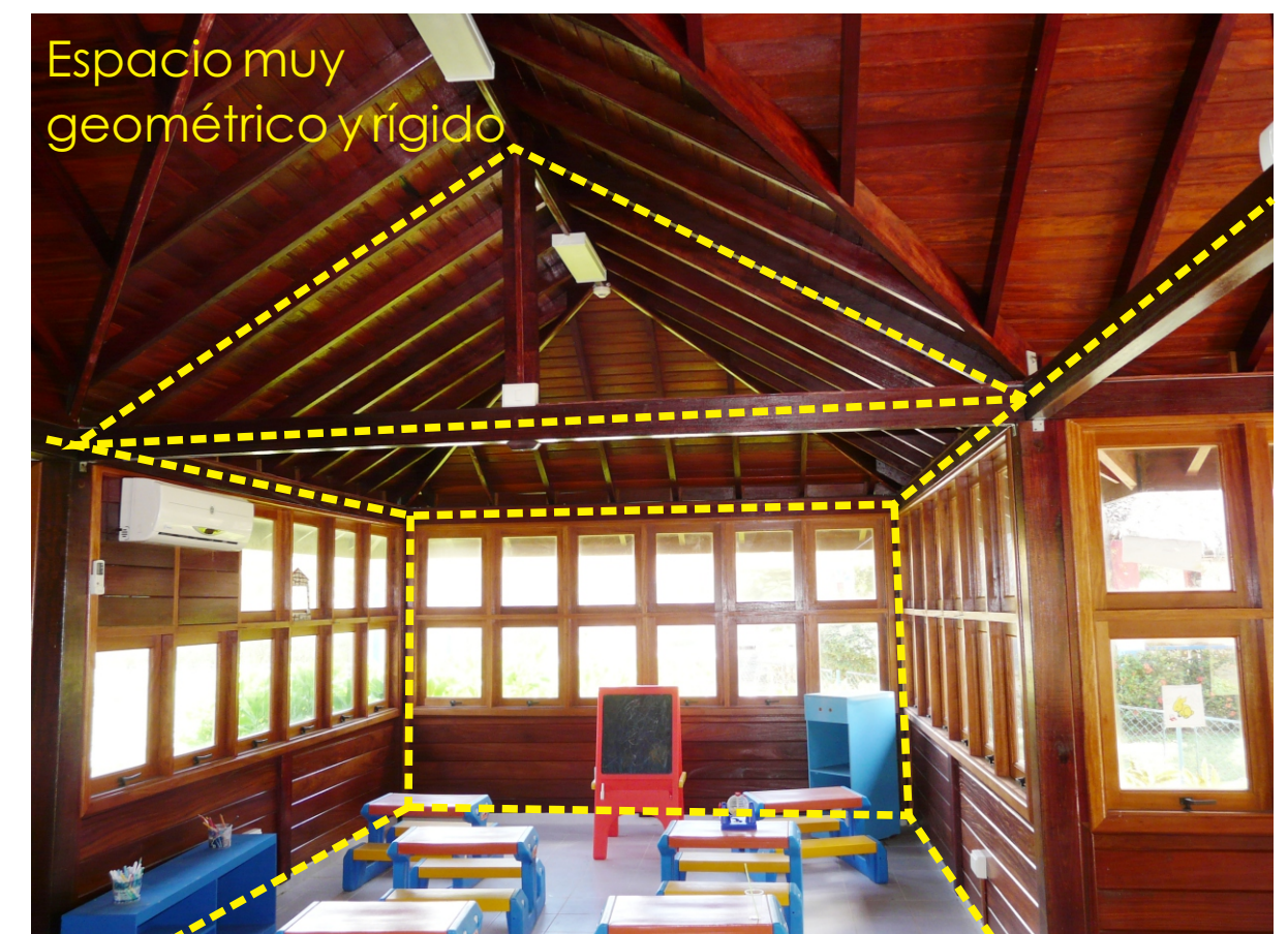
Espacio muy geométrico y rígido