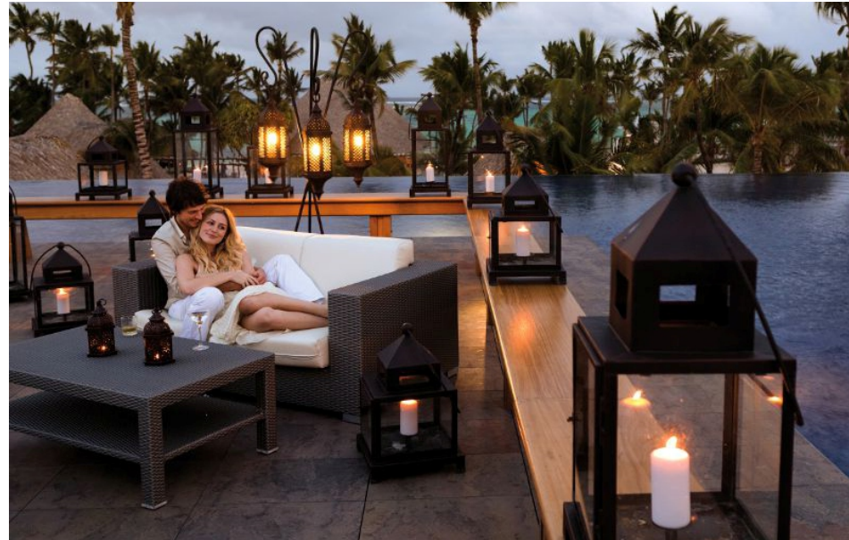
Referencia de ambientación exterior