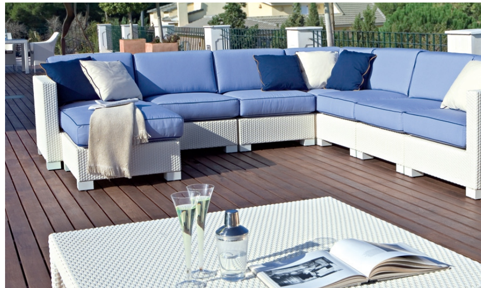
Referencia de mobiliario exterior