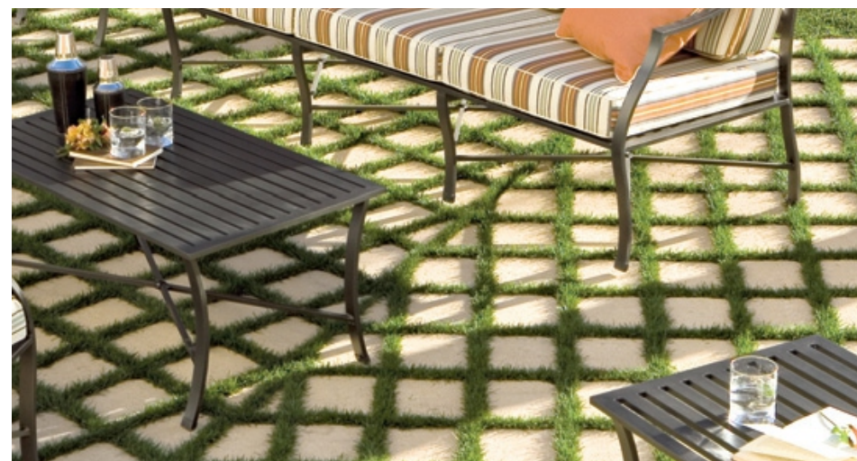
Referencia de pavimento exterior