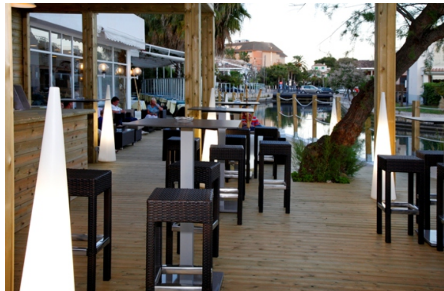
Referencia de luminarias y banquetas