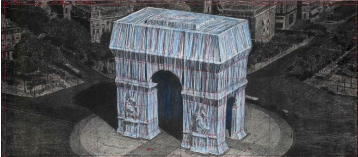
Christo - L'Arc de Triomphe empaqueté (Projet pour Paris - Place de l'Etoile-Charles de Gaulle)

Dessin 2019 en deux parts 15x96" et 42 x 96" (38 x 244 cm et 106.6 x 244 cm)