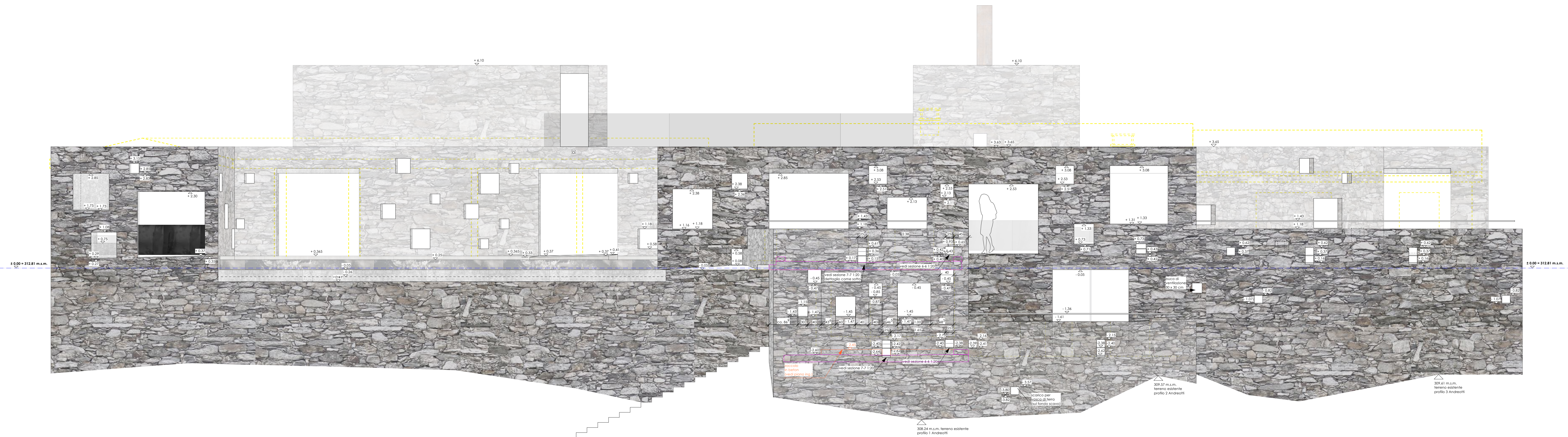
FACCIATA SUD-EST 1:50