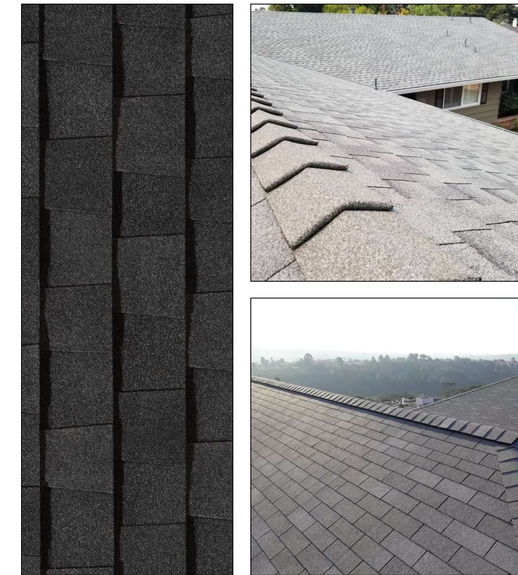
EXEMPLOS DE APLICABILIDADE DA COBERTURA SHINGLE. SUGERIMOS O MODELO DE COR "GRAFITE", CONFORME DETALHE DE IMAGEM A ESQUERDA.