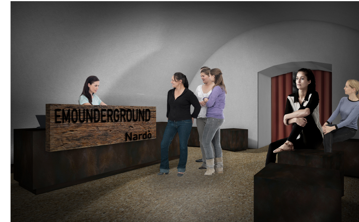
Vista 3D della sala welcome area