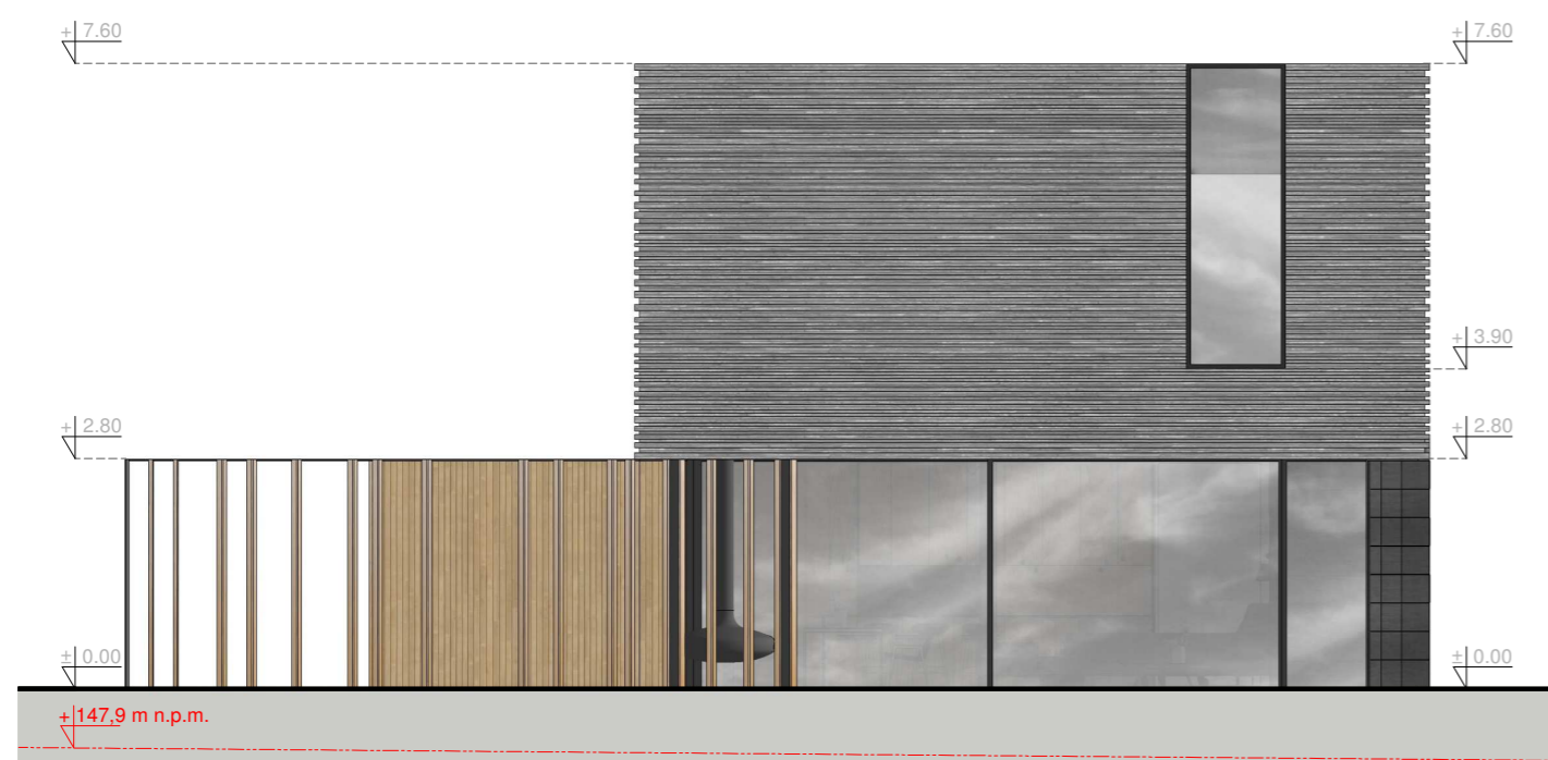
Elevacja frontowa - południowo - zachodnia