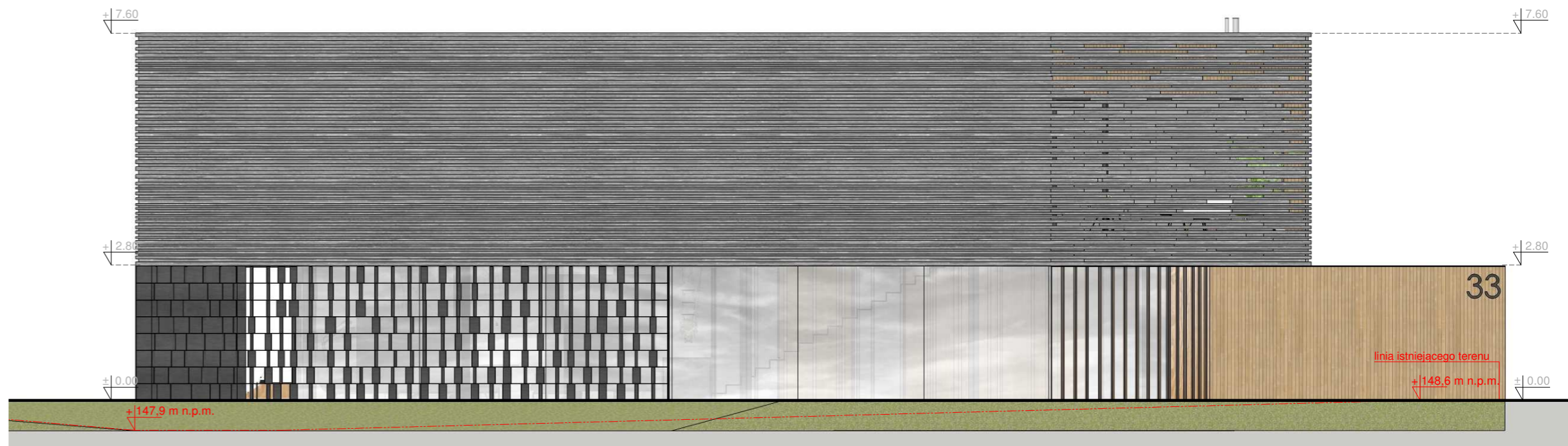
Elevacja południowo - wschodnia