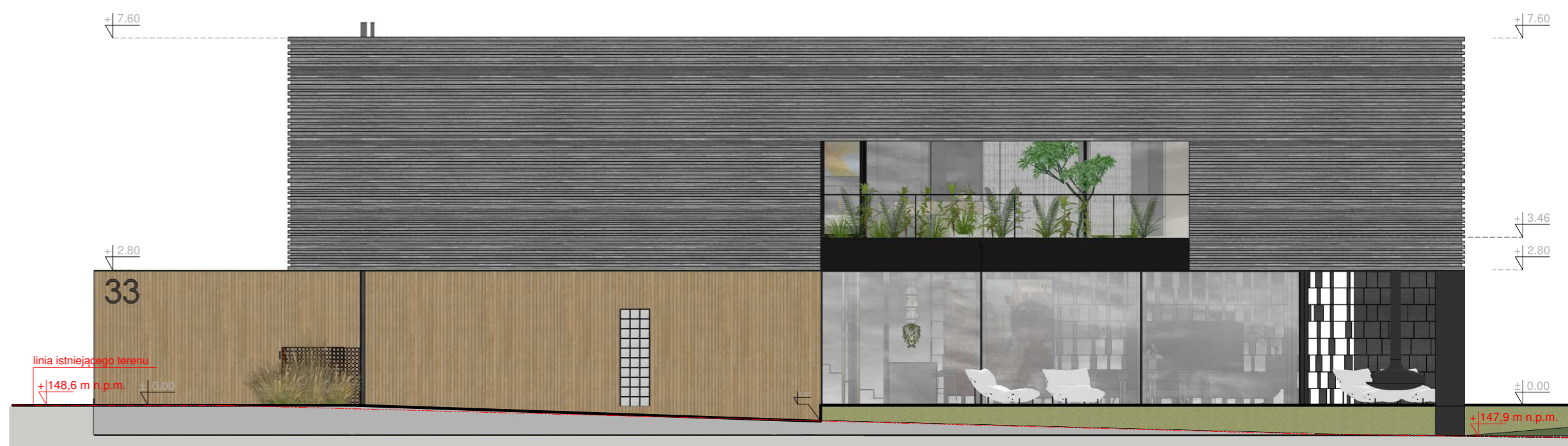
Elevacja frontowa - północno - zachodnia