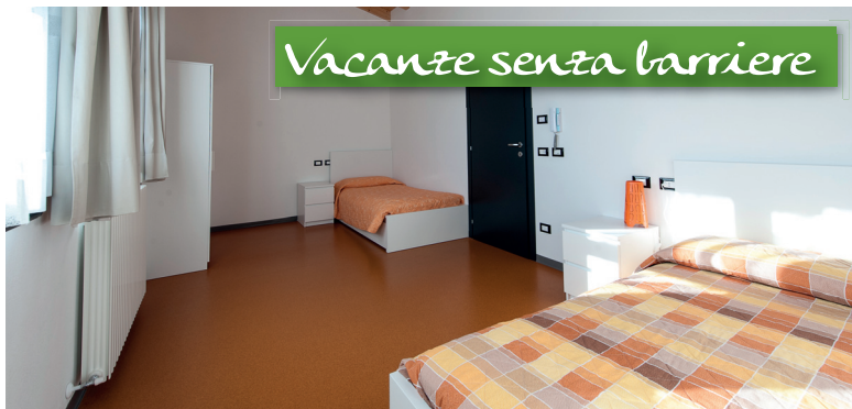
Vacanze senza barriere