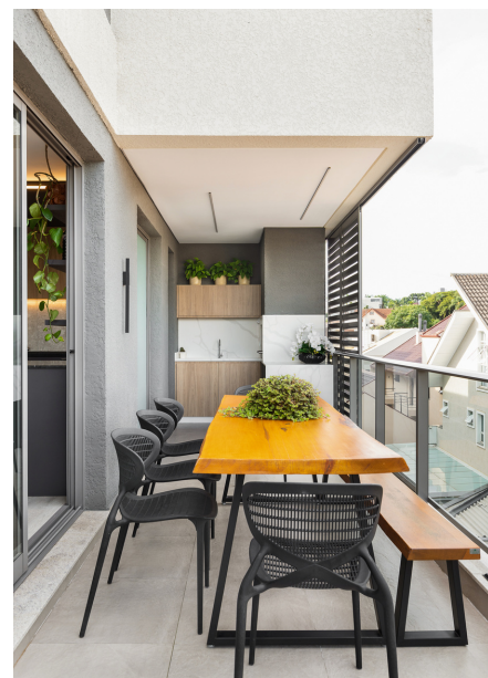
Marco Gural Paisagismo (Jardim vertical) Art Pedra (Marmoraria)