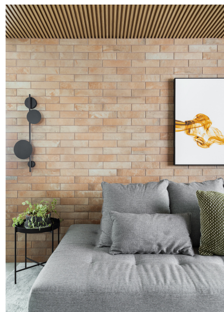
Eliane, Portobello (Revestimentos), VinilForte (Vinílico), LM Móveis (Marcenaria e Serralheria)