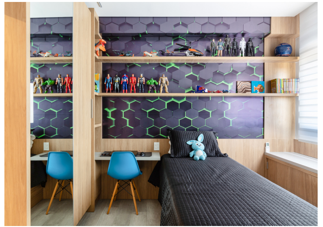
LM Móveis (Marcenaria e Serralheria)