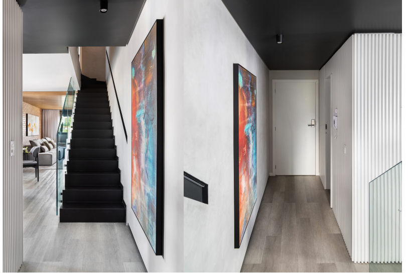
Cometa Vidraçaria (Esquadrias), Eliane, Portobello (Revestimentos), Suvnil (Tintas), VinilForte (Vinílico).