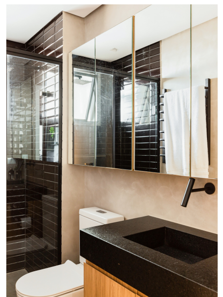
VinilForte (Vinílico).Colormix (Microcimento), LM Móveis (Marcenaria e Serralheria), Suvnil (Pintura).