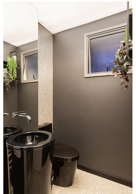
Eliane, Portobello (Revestimentos), Suvnil (Tintas).