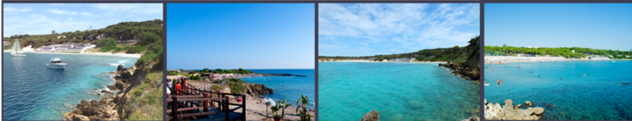
"ARCOIONICO- Resort Salentino" Master-plan includes eight sub-plans connected together. It is placed in Marina di Pulsano (TA), ITALY.