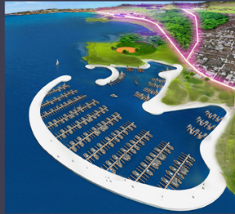
SISTEMAZIONE PORTO E MOLO