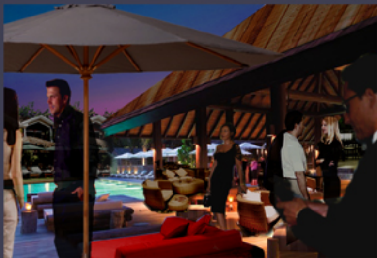
VILLAGGIO TURISTICO 1