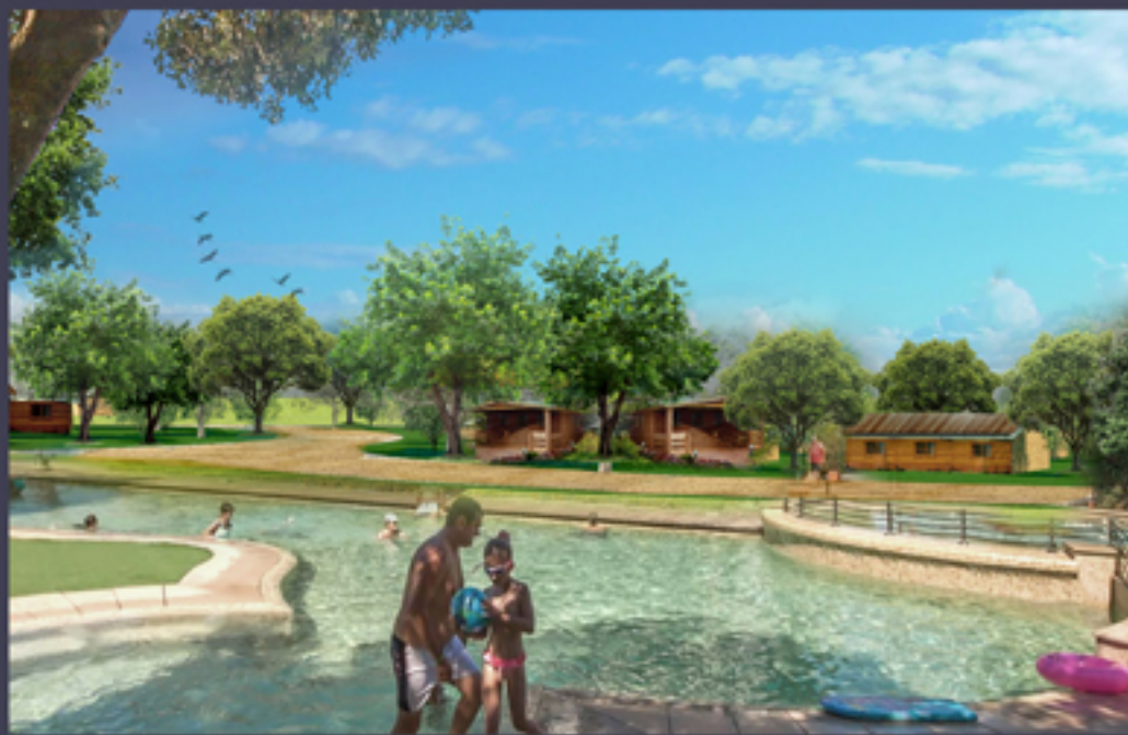
VILLAGGIO TURISTICO 2