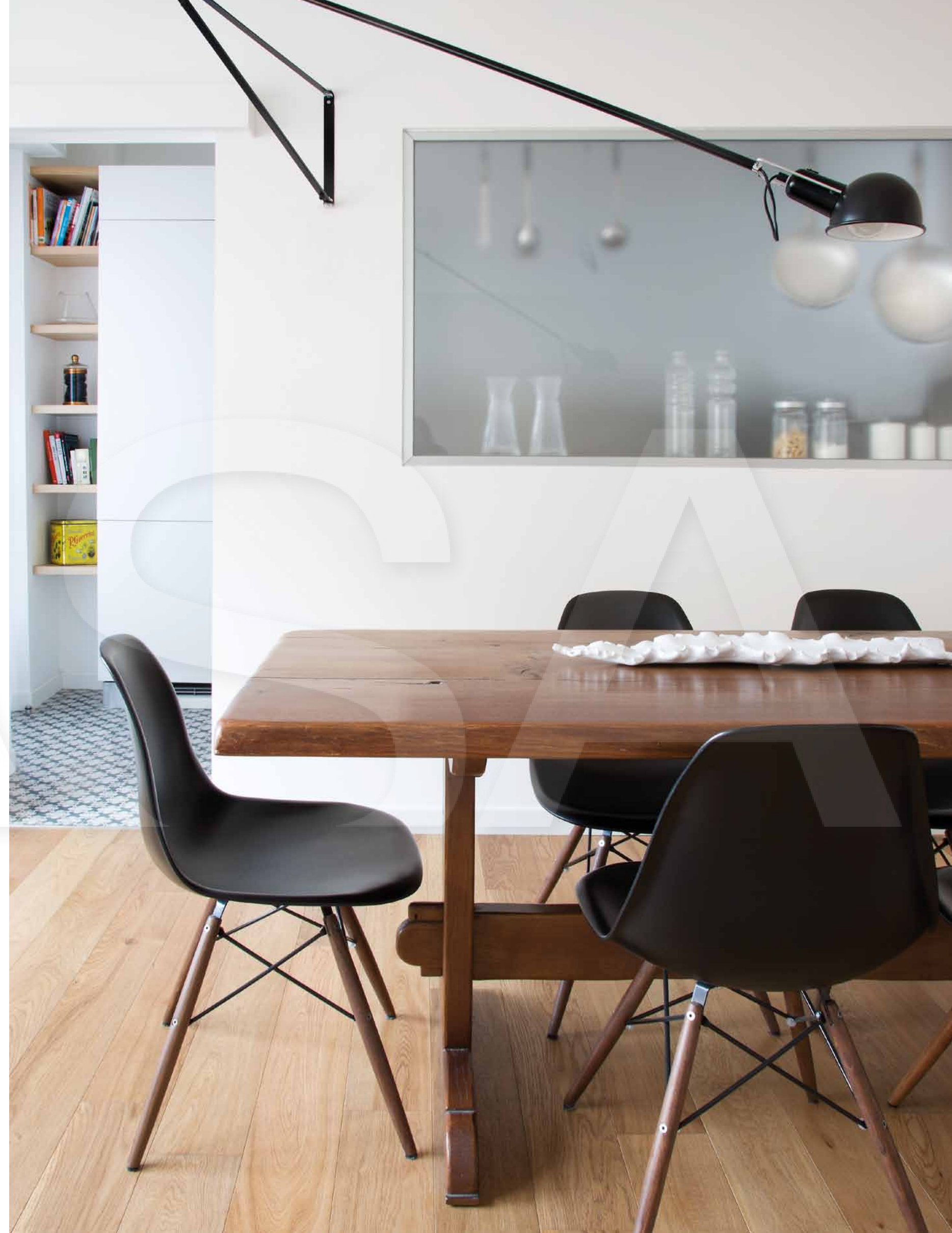
Sopra: l'area pranzo è inondata di luce naturale; posizionata sotto la finestra, un'elegante credenza Chippendal. Il tavolo è in legno noce, massiccio con una struttura possente, alleggerita dalle sedute DSW di Charles Eames prodotte da Vitra. A parete un classico senza tempo, la lampada da tavolo 265 di Flos. A destra: alle spalle del tavolo si intravede e intuisce la cucina che coniuga funzionalità e design; è un ambiente caratterizzato da forte personalità, assolutamente glamour e retrò con le splendide ceramiche di produzione tipica salentina.