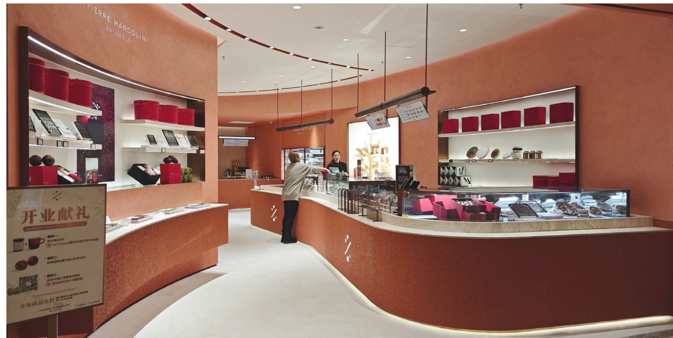
Pierre Marcolini Flagship store a Shanghai