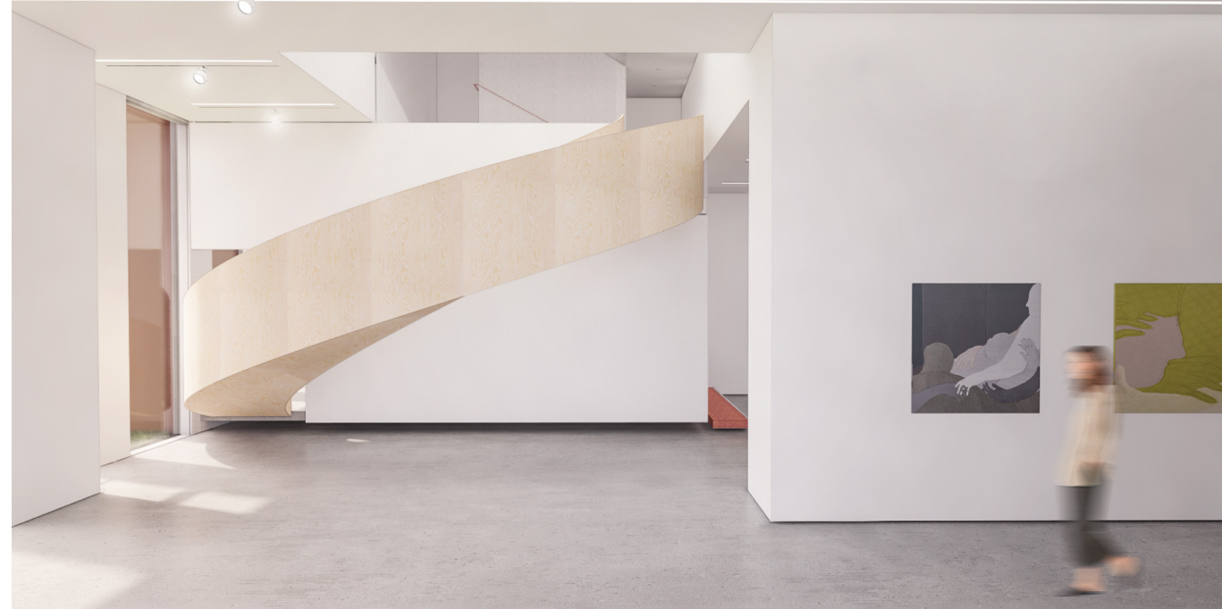
CHART (Chengdu House of Art) Centro Culturale e Museo d'Arte Contemporanea (in costruzione, Cina)