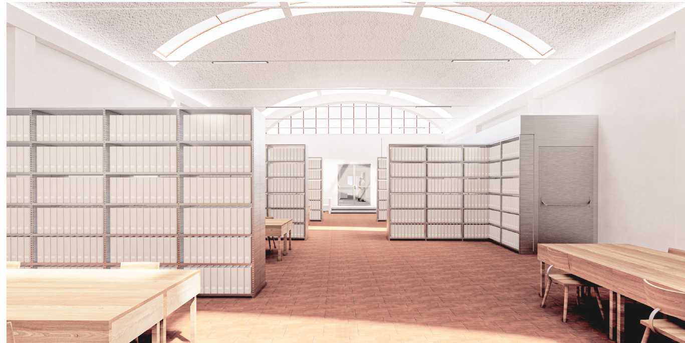
Estensione Museo delle Poste

Recupero e conversione di ex-fabbrica tessile (in costruzione, Prato)