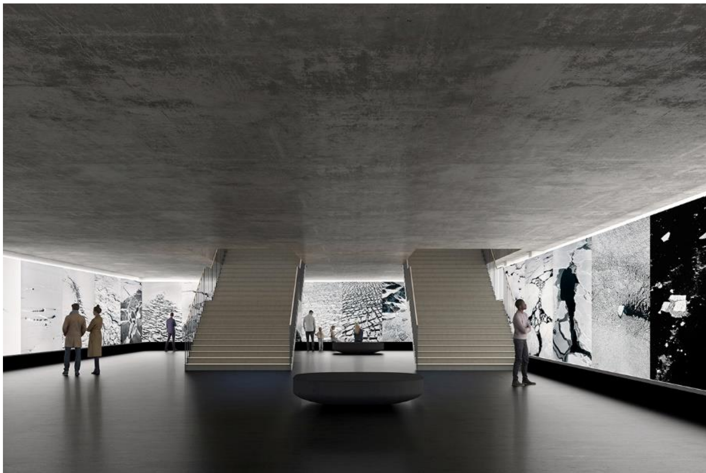
Sala espositiva ipogea.