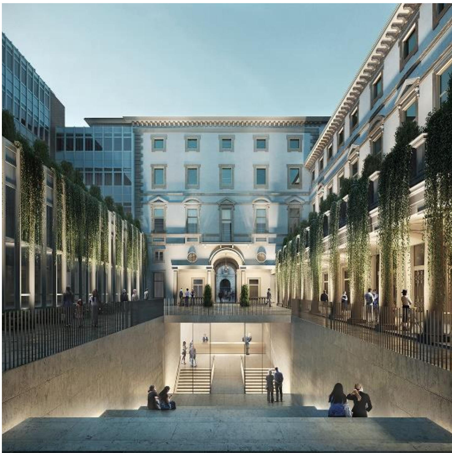
L'ingresso agli spazi ipogei delle nuove Galleria d'Italia – Piazza San Carlo.