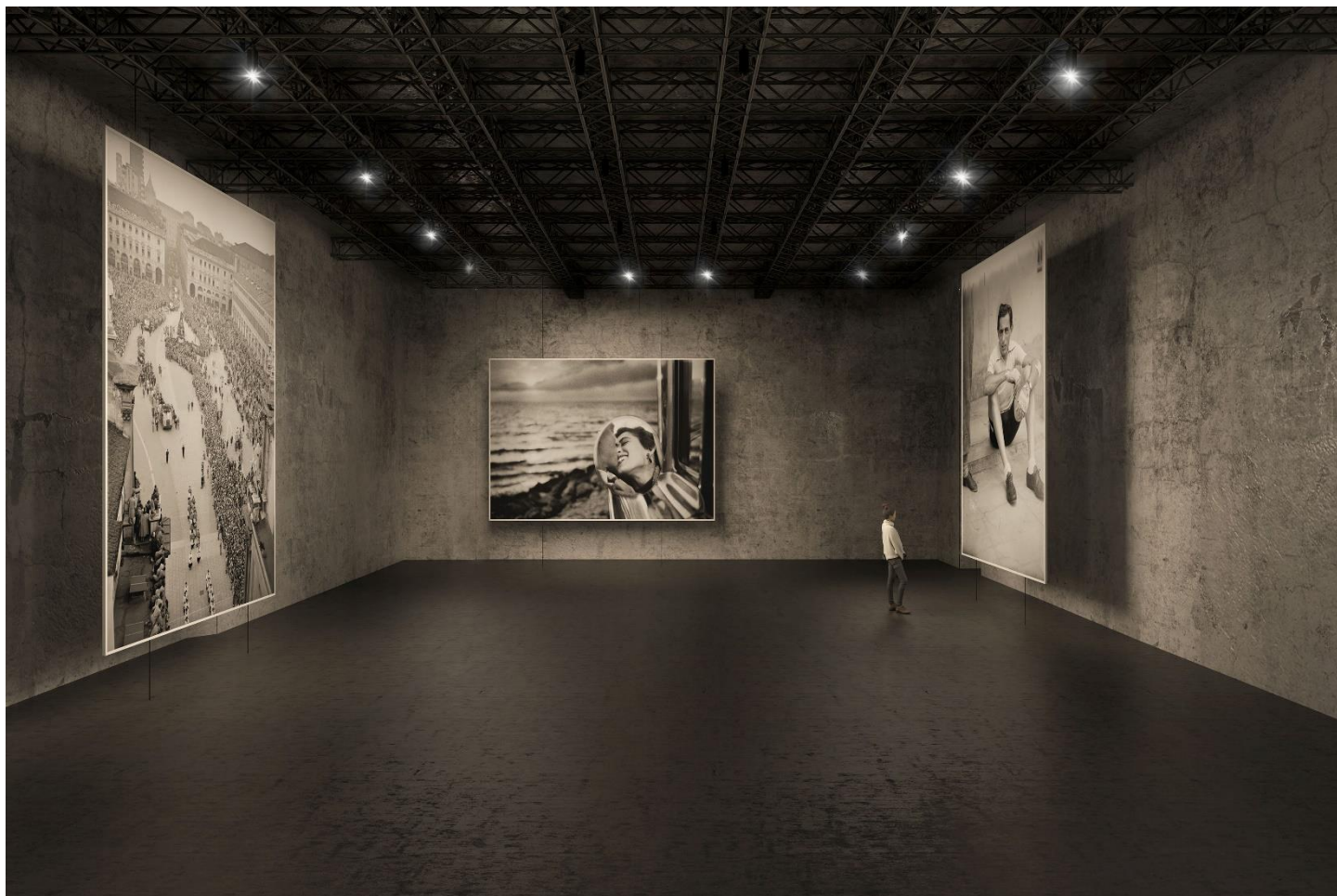
Sala espositiva ipogea. © AMDL CIRCLE.