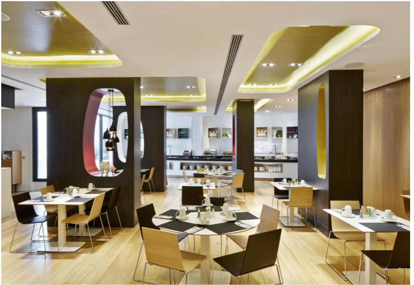
Restaurante y bufet de desayunos con salas de reuniones. Un sistema flexible de tabiques móviles permite dividir los espacio de forma diferente, adaptándolo al uso requerido.