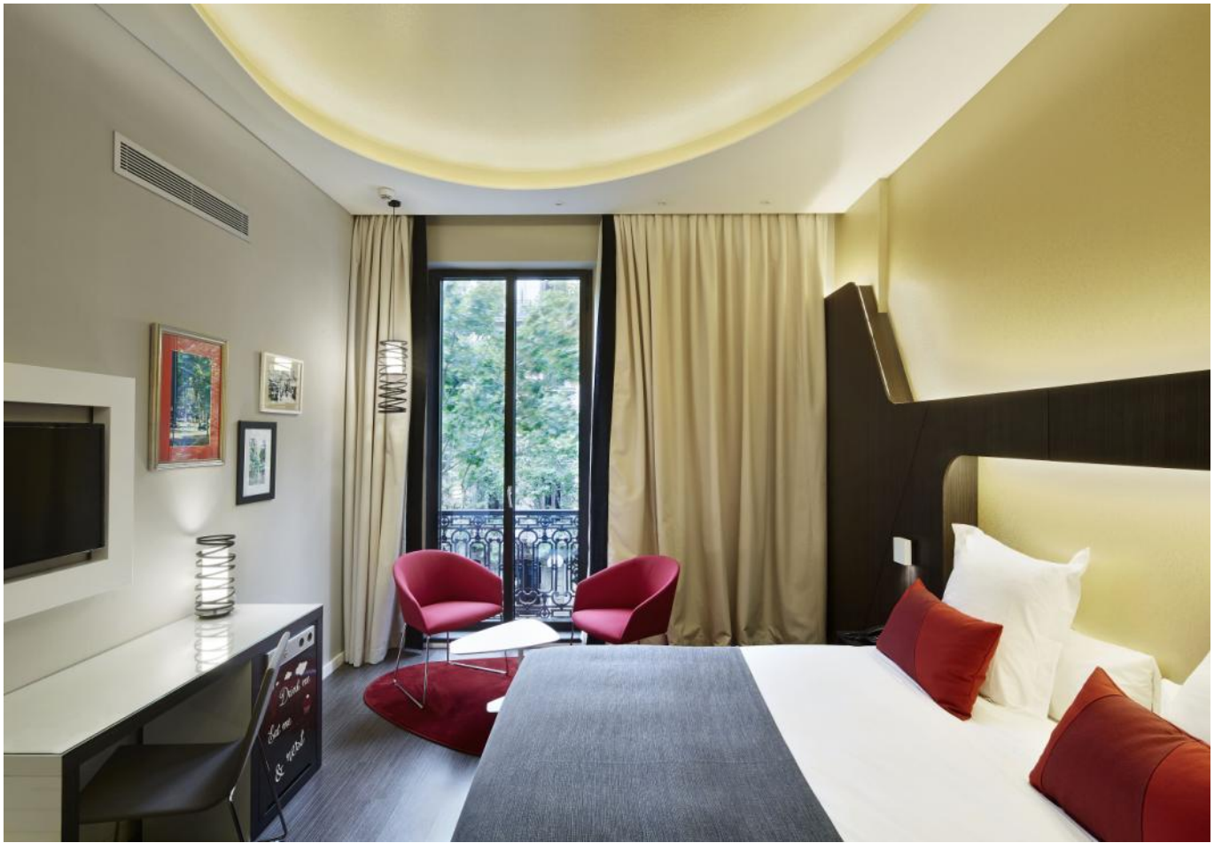
Las tonalidades doradas y los tonos crudos y grisáceos combinados con la iluminación indirecta lineal crean un entorno cálido y elegante.