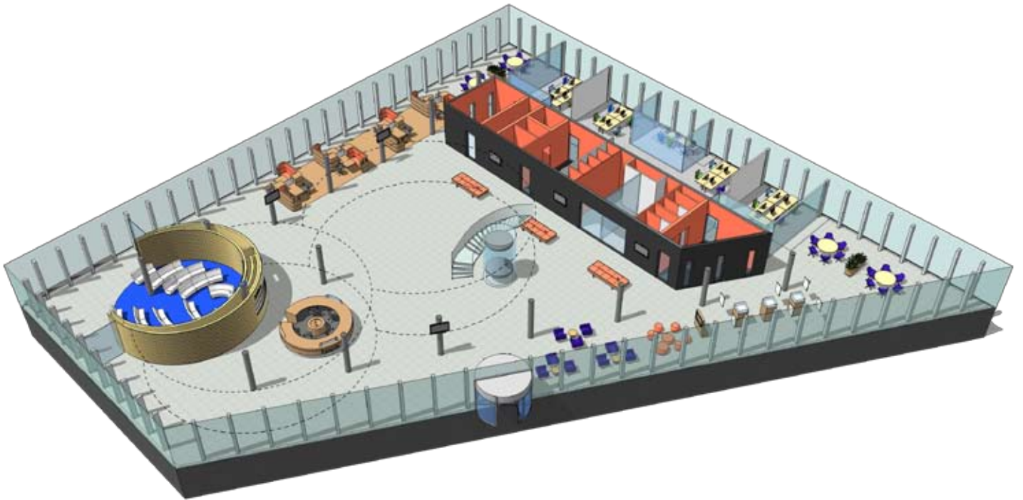
Publiekshal met hoofdentree, receptiebalie, trouwzaal en baliewerkplekken