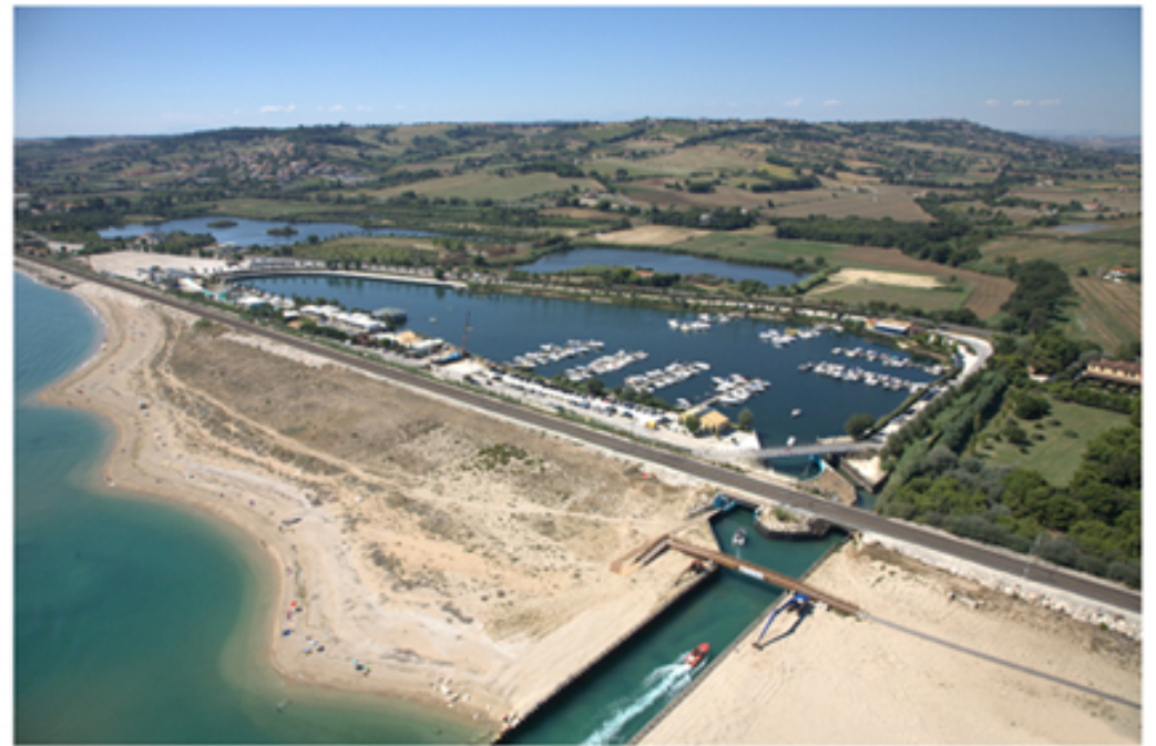
Porto turistico "Le Cinque Vele"