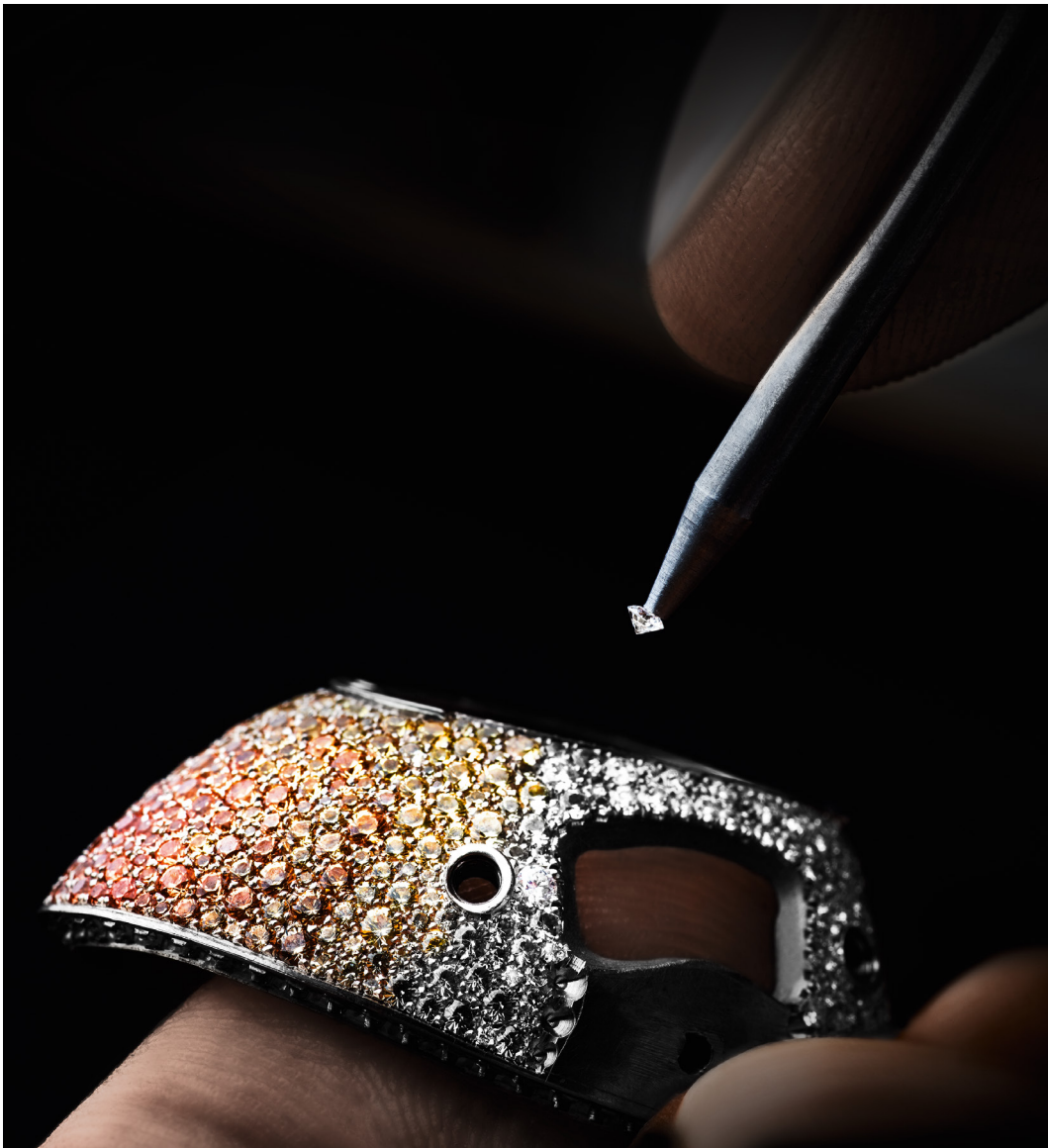
▲ Los diseños de Alta Joyería se elaboran en el centro de la espiral del taller de Oficios Artísticos.

engloba los oficios artísticos: aquí es donde los diseños de Alta Joyería son concebidos y elaborados por maestros joyeros, engastadores y grabadores. Con su perspectiva del pasado, el presente y el futuro, estos dos talleres, donde todavía hoy se producen algunas de las creaciones más elaboradas de Audemars Piguet, encarnan el espíritu sin concesiones de la Manufactura.