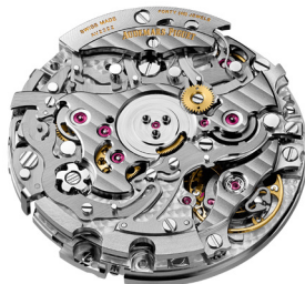
Lado del fondo