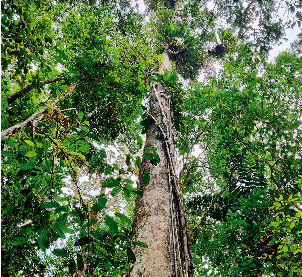
▲ Bálsamo ( Myroxylon balsamum ), Ecuador. La Fundación Audemars Piguet ha contribuido a la conservación forestal del planeta con diversas iniciativas tales como este proyecto de agroforestación y comercio justo iniciado en 2018 en la selva amazónica del Ecuador.