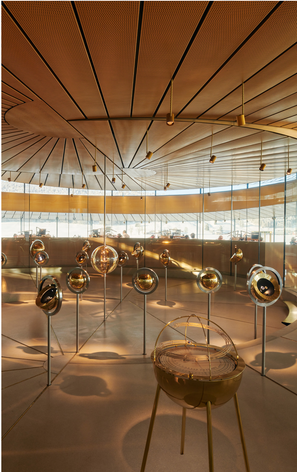
▲ En el centro de la espiral, el taller de Grandes Complicaciones y las piezas de sonería, astronómicas y de cronógrafo giran en torno al modelo Universelle (1899), el reloj de bolsillo más complicado que ha producido nunca Audemars Piguet.