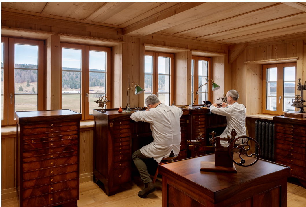
▲ El taller de Restauración está emplazado en el piso superior de la casa histórica donde Jules Louis Audemars y Edward Auguste Piguet establecieron el negocio en 1875.