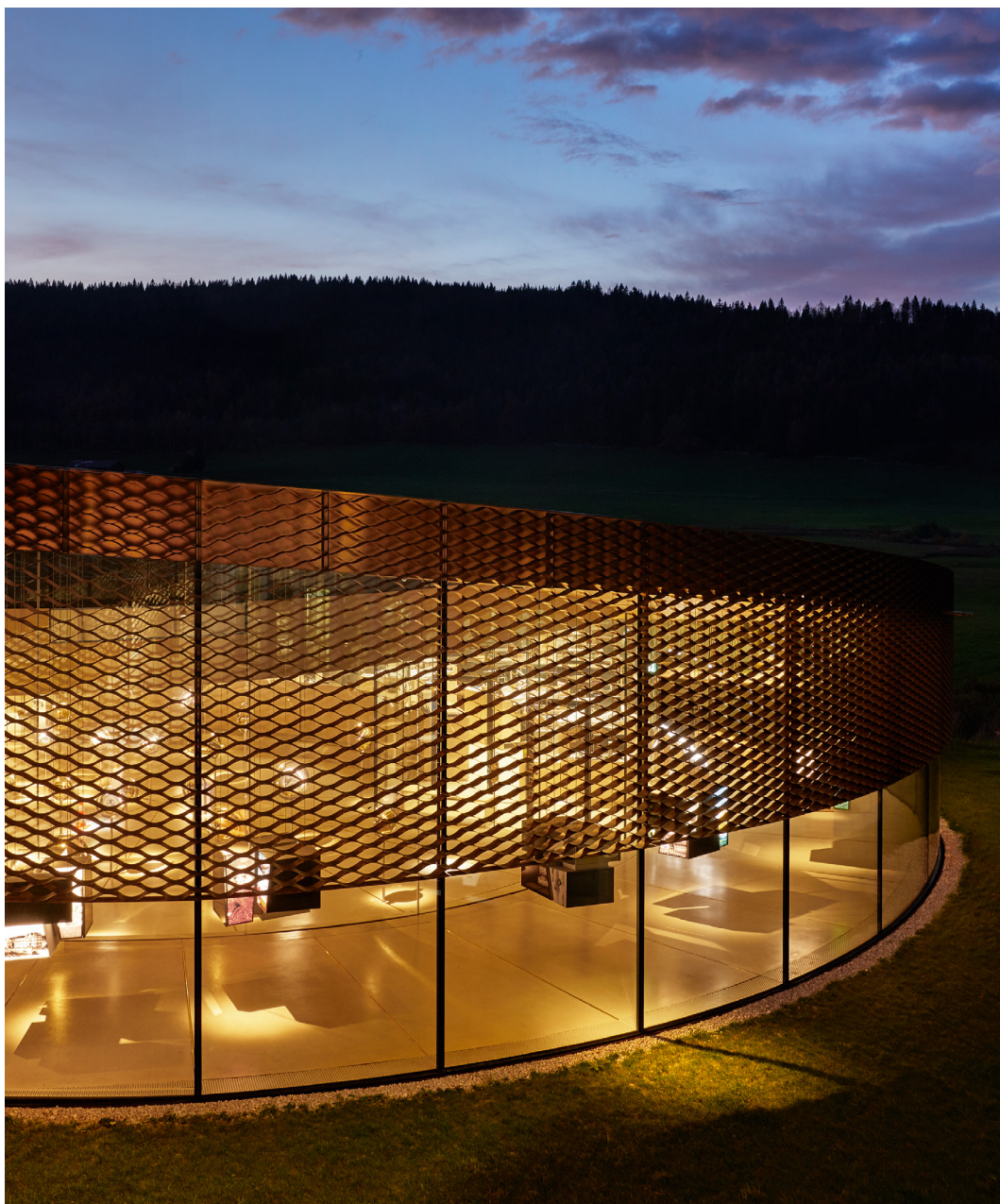
▲ La espiral diseñada por BIG está totalmente soportada por paredes de vidrio curvas, mientras que una malla de latón reviste la superficie exterior a fin de regular la temperatura y la luz, sin obstruir la vista.

La compañía también está inmersa en la construcción del nuevo Hôtel des Horlogers en su localidad natal de Le Brassus, que abrirá sus puertas en verano de 2021: un espacio sostenible y contemporáneo en la encrucijada entre modernidad y tradición, encargado también al estudio BIG con CCHE como socio local.