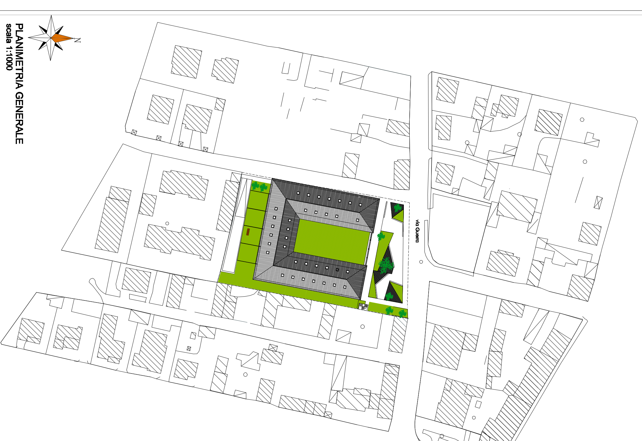
PLANIMETRIA GENERALE scala 1:1.000

_____ committente _____ impresa _____ progettista