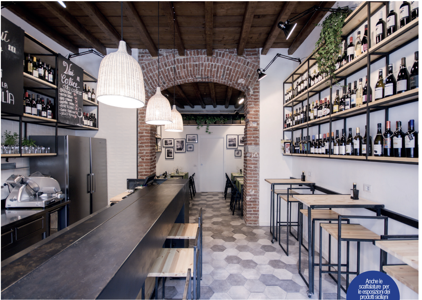
Anche le scaffalature per le esposizioni dei prodotti siciliani rimarcano il carattere materico del progetto