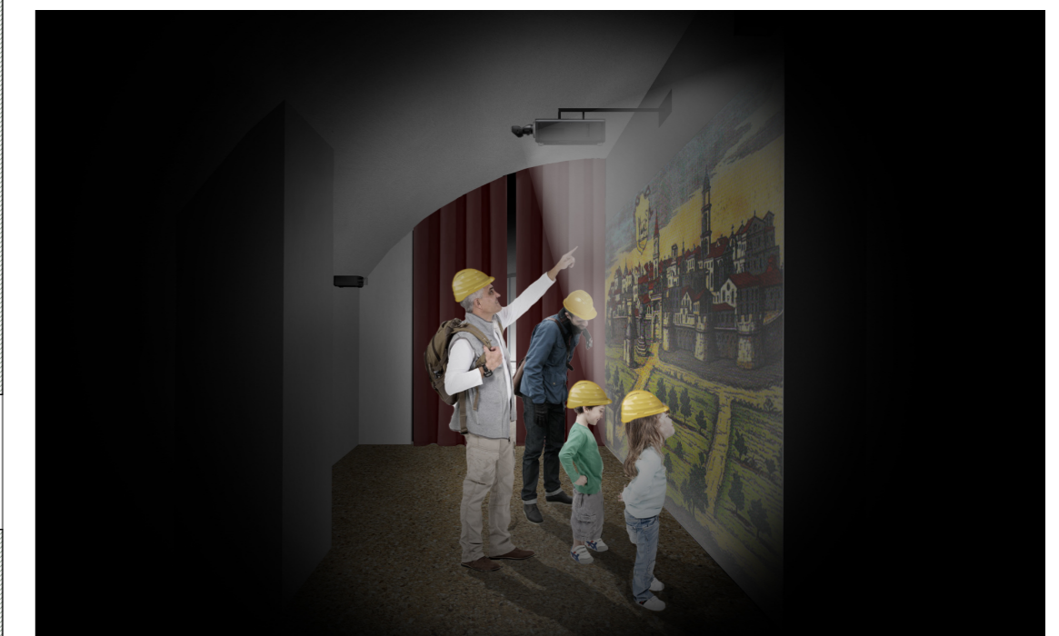
Vista 3D della sala wallmapping area