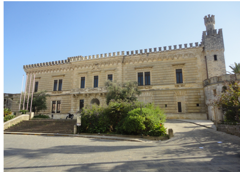
Tavole tecniche relative alla progettazione del percorso tecnologico emozionale da prevedere nei sotterranei e sulle terrazze esterne del Castello Acquaviva d'Aragona di Nardò

Proposta di servizi di assistenza tecnica al project management e di progettazione e sviluppo di percorsi tecnologici emozionali innovativi per la valorizzazione dei sotterranei del Castello di Nardò nell'ambito del progetto emoundergrounds