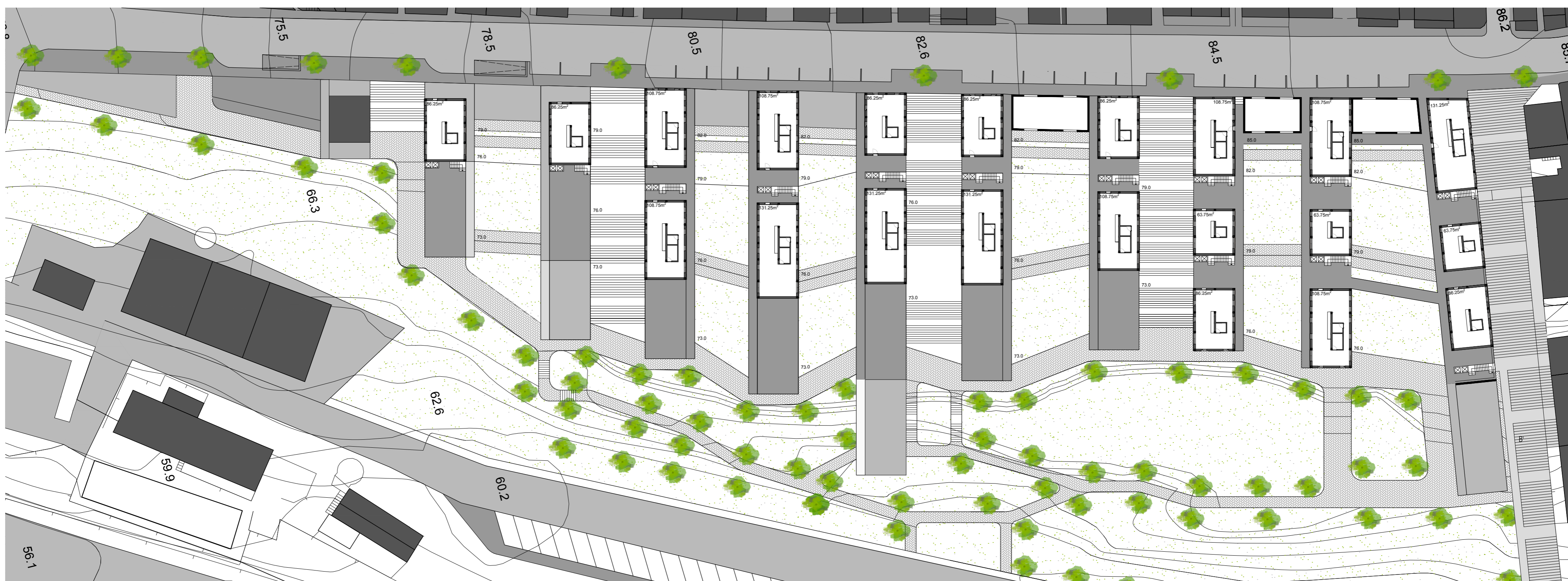
Planta à cota 86.2m Esc: 1/500