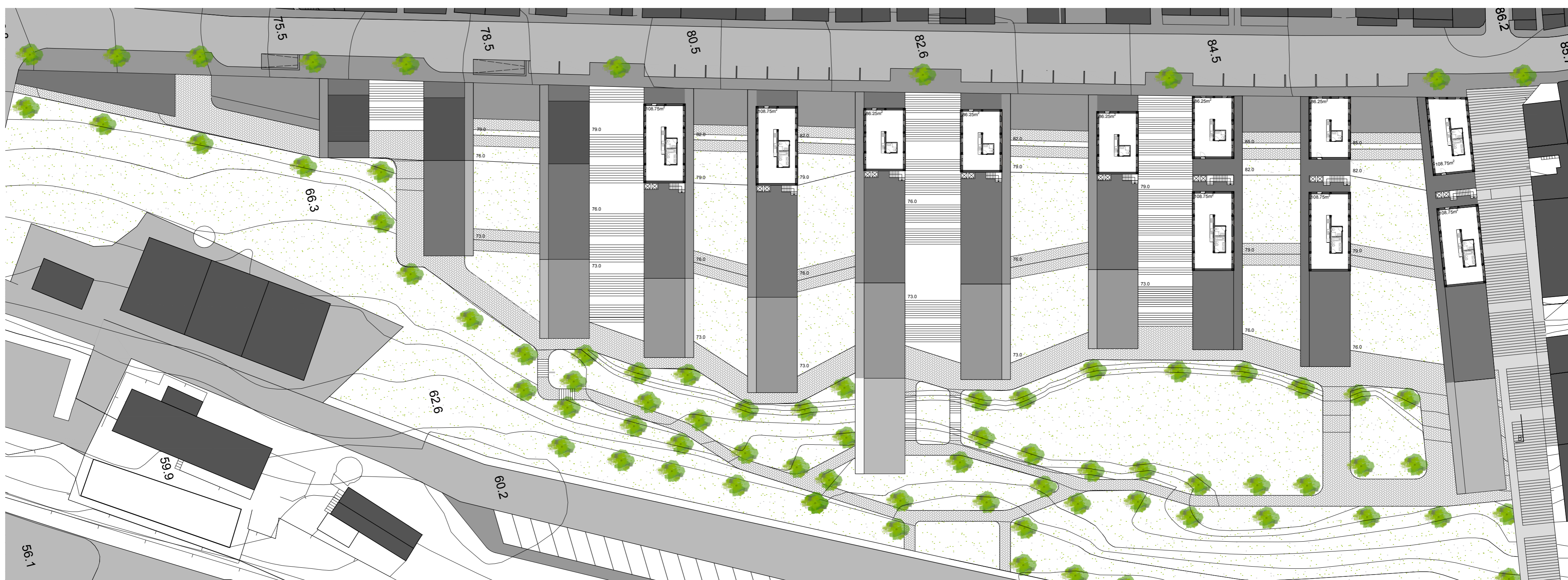
Planta à cota 89.2m