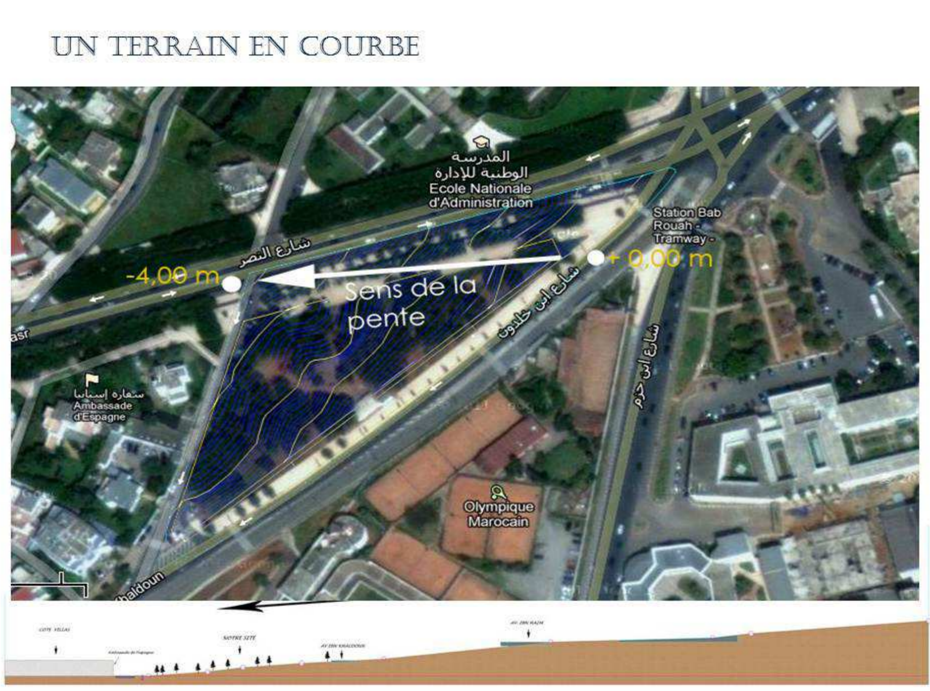
TOPOGRAPHIE ET COUPE SUR LE TERRAIN