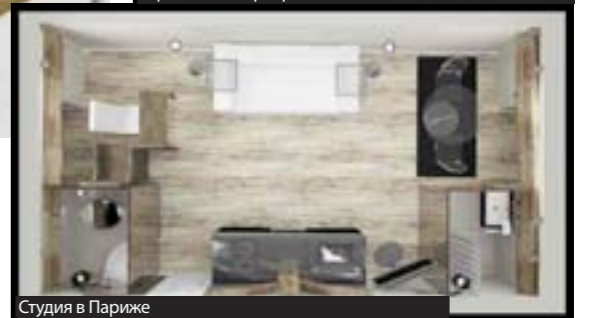
Студия в Париже

наши страны. А как вам работается в России как архитектору?