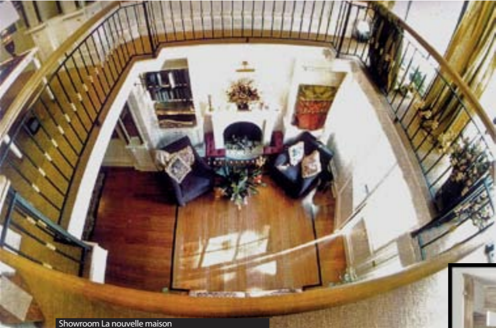
Showroom La nouvelle maison

Думаю, не всегда это так. Потому что высокую моду совершенно невозможно шить в других странах, например, в Китае, чем грешат иногда некоторые марки прет-а-