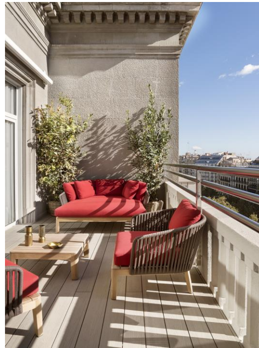
Terraza de la Suite

La presencia de estanterías con libros y la calidez de la gama de colores de cada habitación, hacen que el huésped se encuentre en un ambiente acogedor. También en los baños, Beriestain ha querido recrear un ambiente cálido y confortable que ha conseguido gracias a la utilización del mármol en tono arcilloso y de las griferías en latón envejecido. El toque de exclusividad de las habitaciones lo consigue gracias al papel pintado de las paredes, obra de un artista pintor y producido de forma exclusiva para este proyecto. No menos importante es la cuidadosa iluminación con apliques para conseguir un ambiente íntimo en cada estancia.