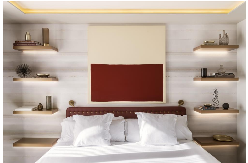
Hotel Vincci Mae de Barcelona

En plena Avenida Diagonal de Barcelona, el Hotel Vincci Mae cuenta con 85 habitaciones, 3 de las cuales son suites. Este establecimiento ofrece a sus clientes servicio de bar y restaurante, ambos con acceso directo a dos terrazas desde las que se pueden contemplar unas inmejorables vistas de la ciudad. La terraza del bar cuenta con plunge pool , área con hamacas y una zona donde se pueden degustar tapas y cócteles. El restaurante abre paso a una amplia terraza para disfrutar de comidas y cenas a la carta al aire libre.