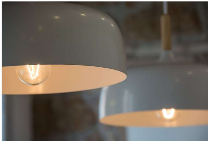
Vedi Scheda Progetto