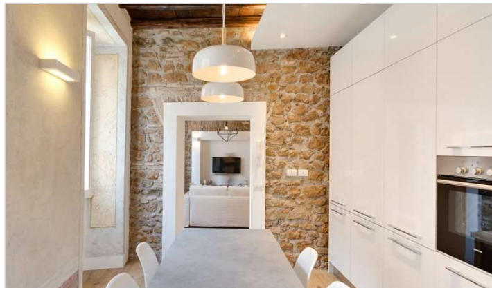
Vedi Scheda Progetto

Questo sito utilizza i cookies. Continuando la navigazione l'utente acconsente al loro utilizzo in conformità con i Termini d'uso.