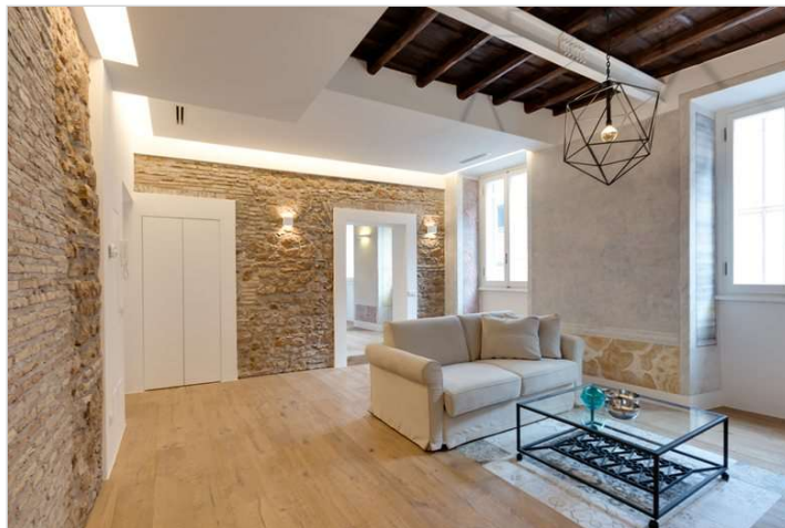
Vedi Scheda Progetto