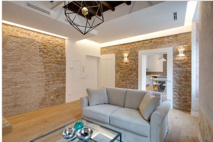
Vedi Scheda Progetto