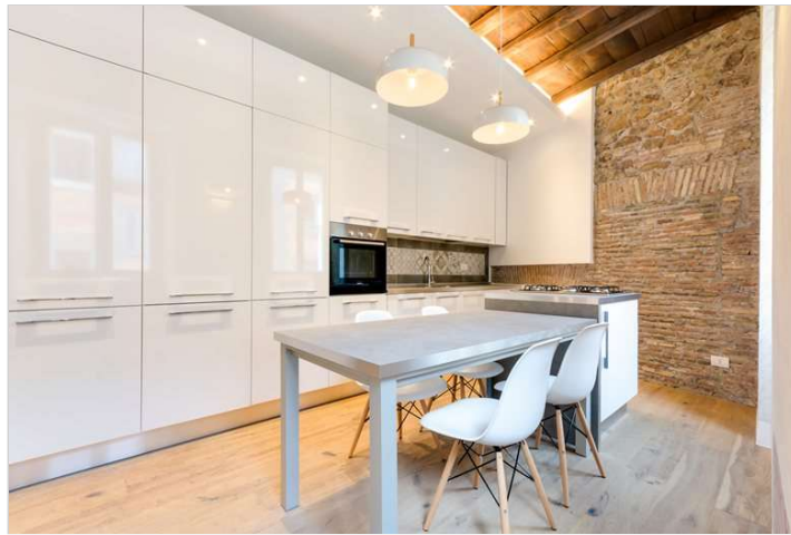
Vedi Scheda Progetto