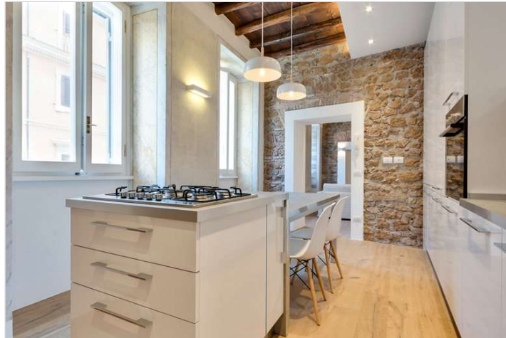
Vedi Scheda Progetto