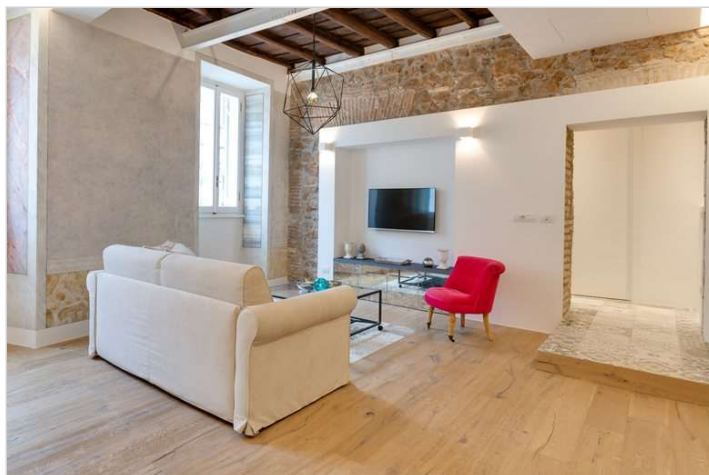
Vedi Scheda Progetto