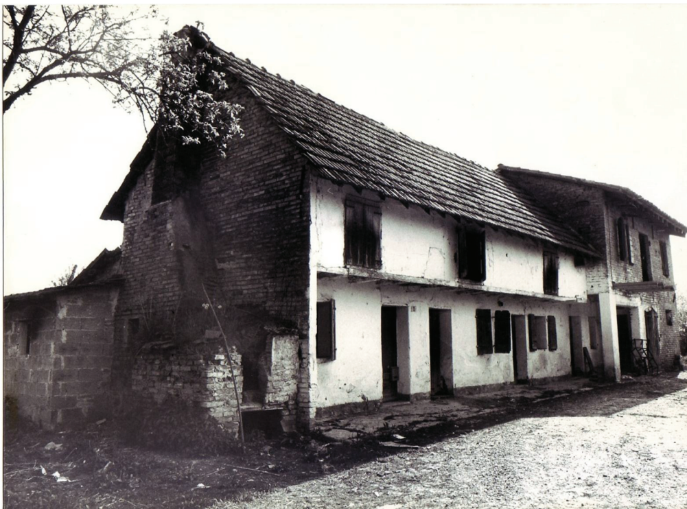
Cavalier - Fossalta