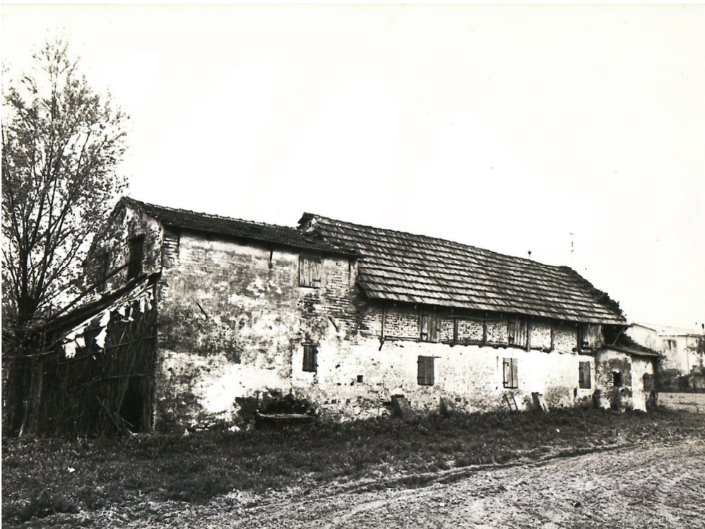
Navolè di Gorgo al Monticano

La paglia è stata sostituita da tegole in cotto tipo marsigliese, in seguito gli edifici sono stati elevati di uno, due piani e i tetti con nuove capriate hanno modificato la loro pendenza ospitando manto di copertura in coppi