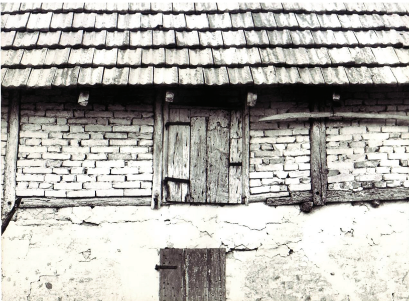
Particolare Navolè di Gorgo al Monticano