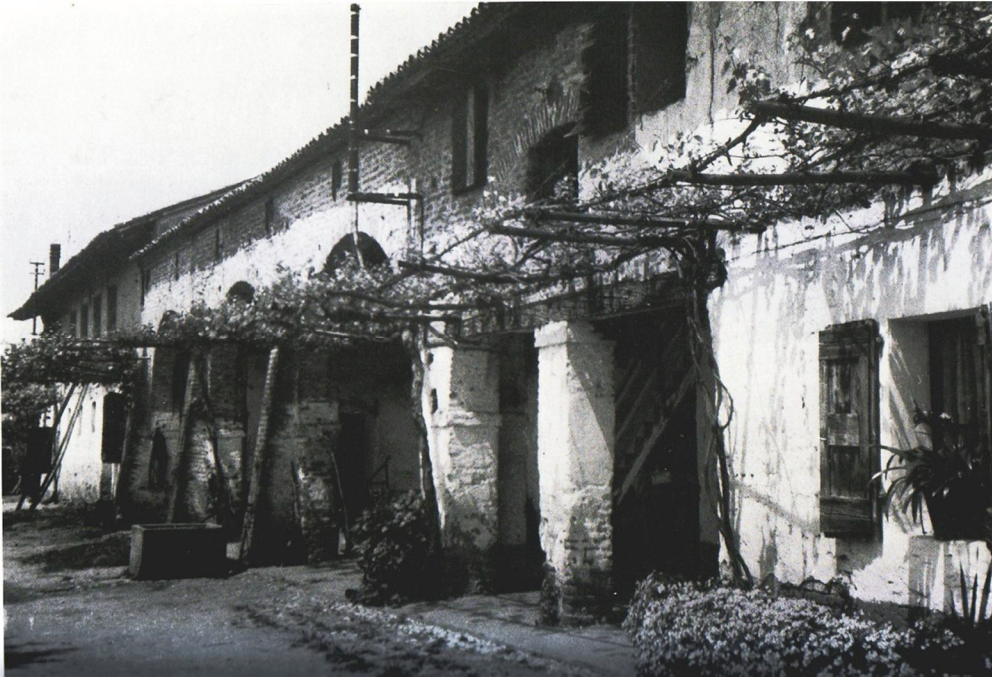
Tratto da “ la casa rurale nel Veneto” Giunta Regionale del Veneto Volume curato dall'arch. Ettore Vio – Edizioni Multigraf (VE)

L'abitazione verrà posizionata nel sedime del precedente edificio nel rispetto dell'ambito e dell'orientamento tipico delle case rurali Sul fronte come elemento decorativo e funzionale è stata riproposta una pergola, struttura che si trovava spesso nelle case rurali orientate a sud-ovest, favorivano l'ombreggiamento estivo grazie alla vite di produzione primaticcia – uva bianca di sant'anna che sopra si propagava prima delle qualità produttive insieme.