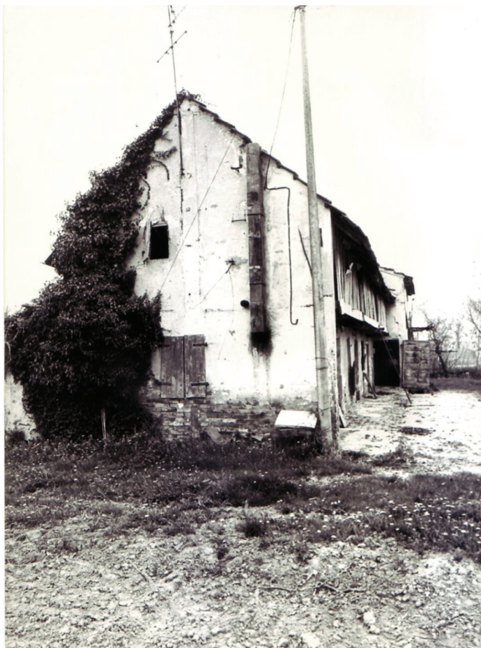
Cavalier - Fossalta