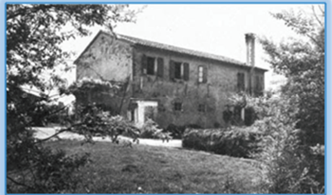
Tratto da “CLIMA E ARCHITETTURA: architettura spontanea-bioclimatica” articolo sul web