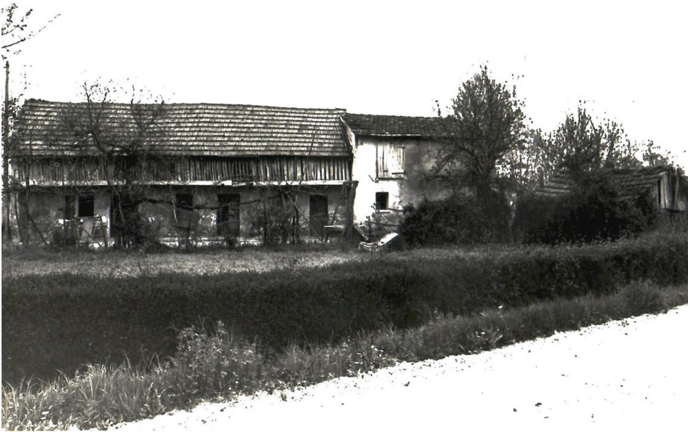
Navolè di Gorgo al Monticano

La paglia è stata sostituita da tegole in cotto tipo marsigliese, in seguito gli edifici sono stati elevati di uno, due piani e i tetti con nuove capriate hanno modificato la loro pendenza ospitando manto di copertura in coppi