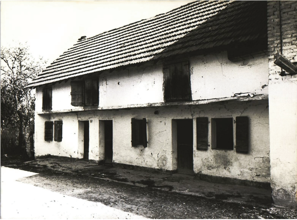
Cavalier - Fossalta