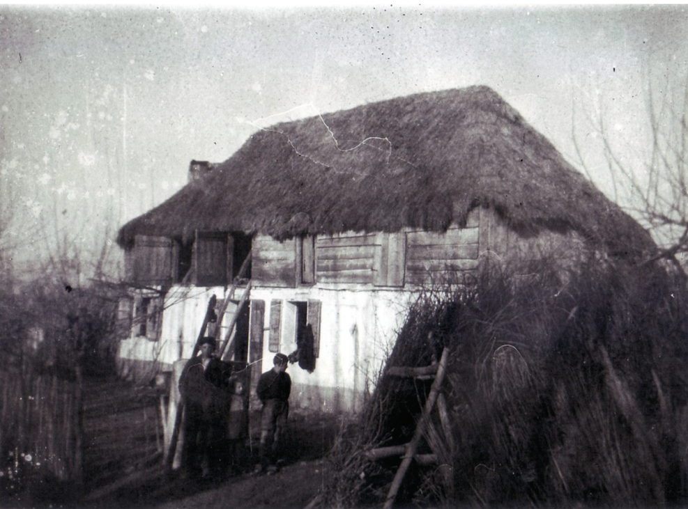
Chiarano - Fossalta

L'evoluzione nella storia ha portato a sopraelevare il tetto al fine di avere spazio utile per le esigenze legate al lavoro nei campi, tamponando la struttura al di sopra della base in muratura con legno o mattoni.