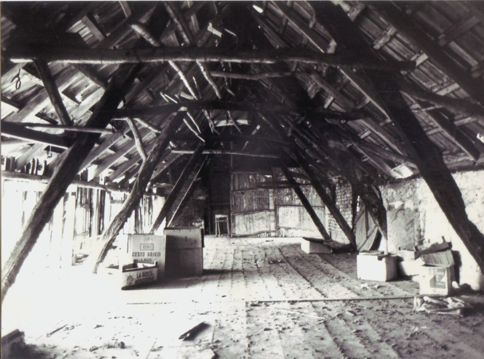
Chiarano - Fossalta

Le abitazioni nelle zone agricole presenti nel nostro territorio derivano dai casoni manufatti poveri costituiti da un basamento in mattoni crudi mentre la copertura era realizzata su una struttura lignea con acuti spioventi in canne palustri.