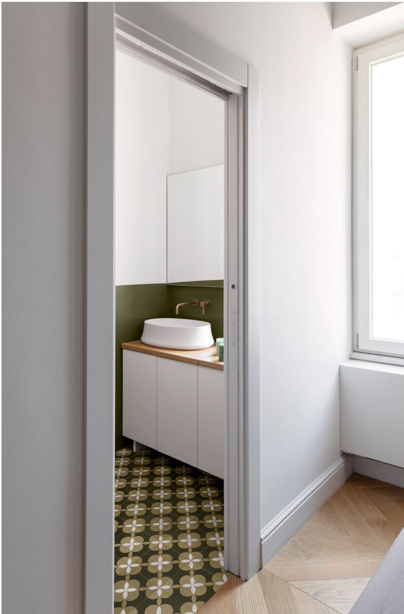
FADD Architects, Napoli