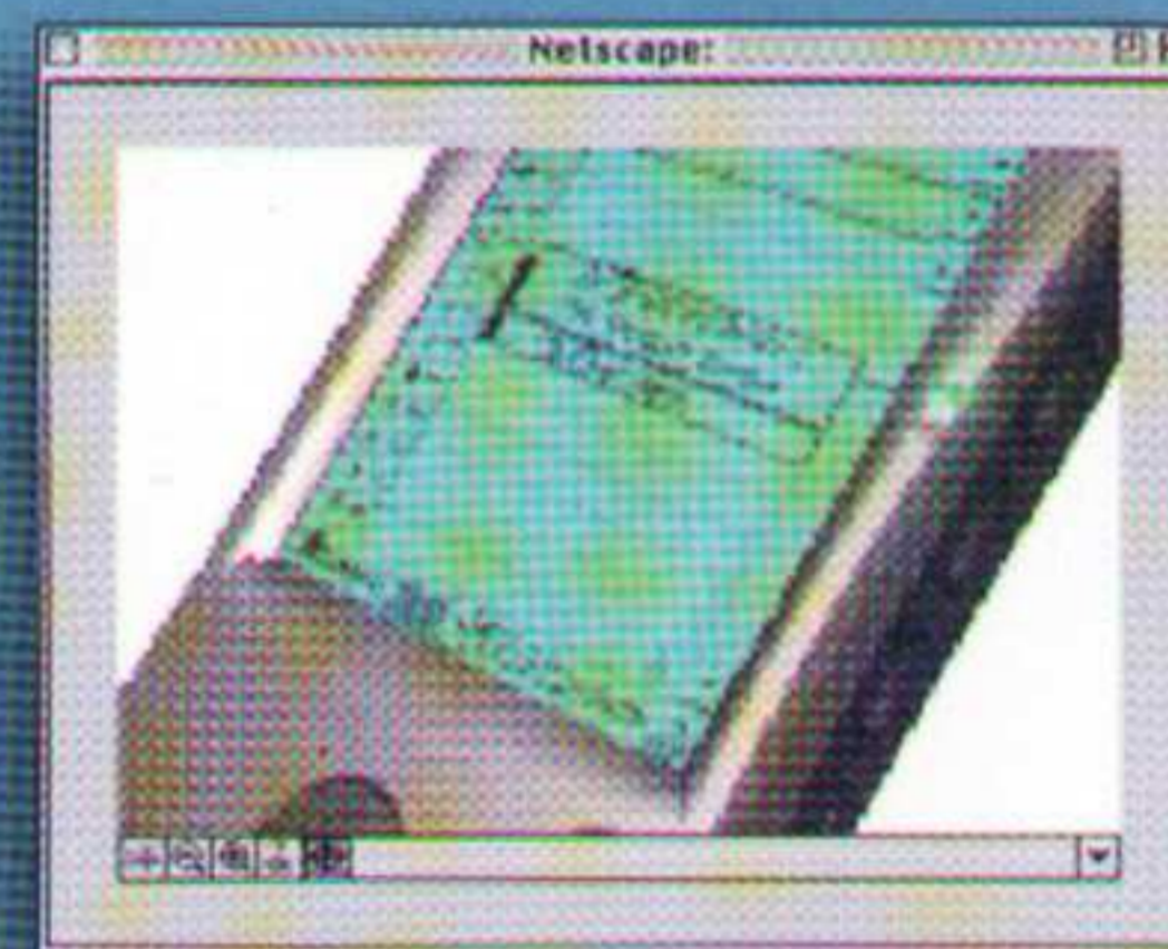
Lo specchio dell'interfaccia Interface mirror