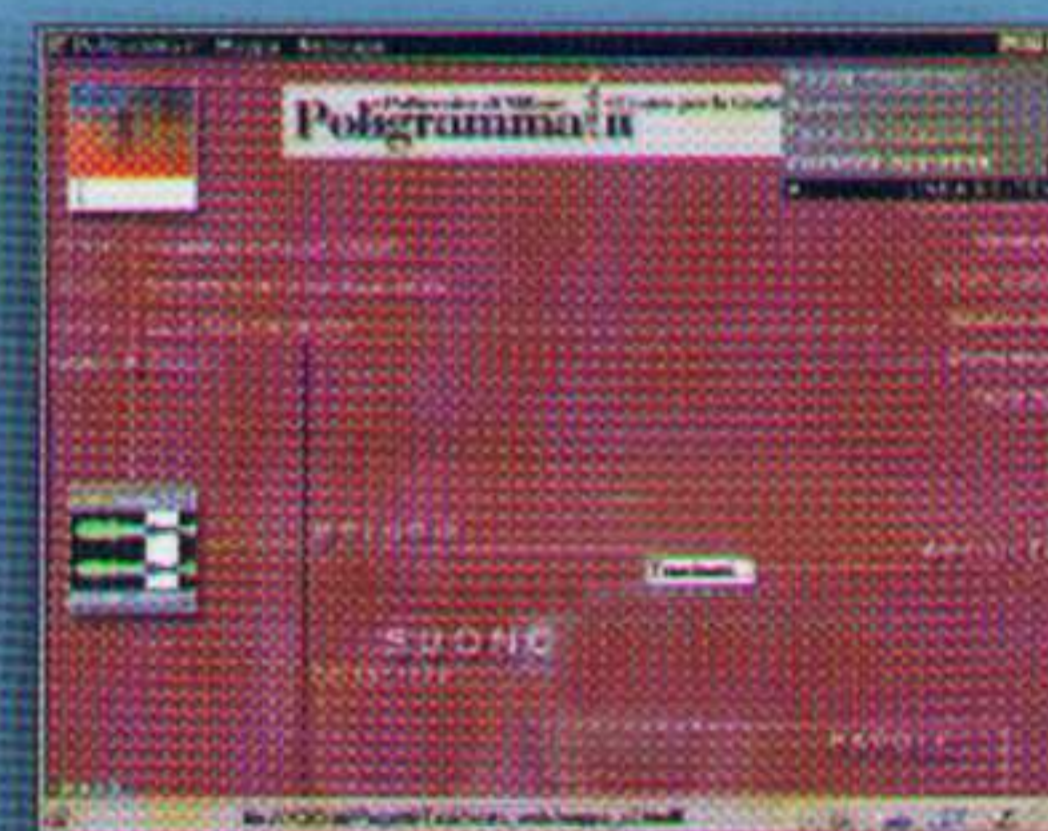
Un periodico integrato An integrated periodical