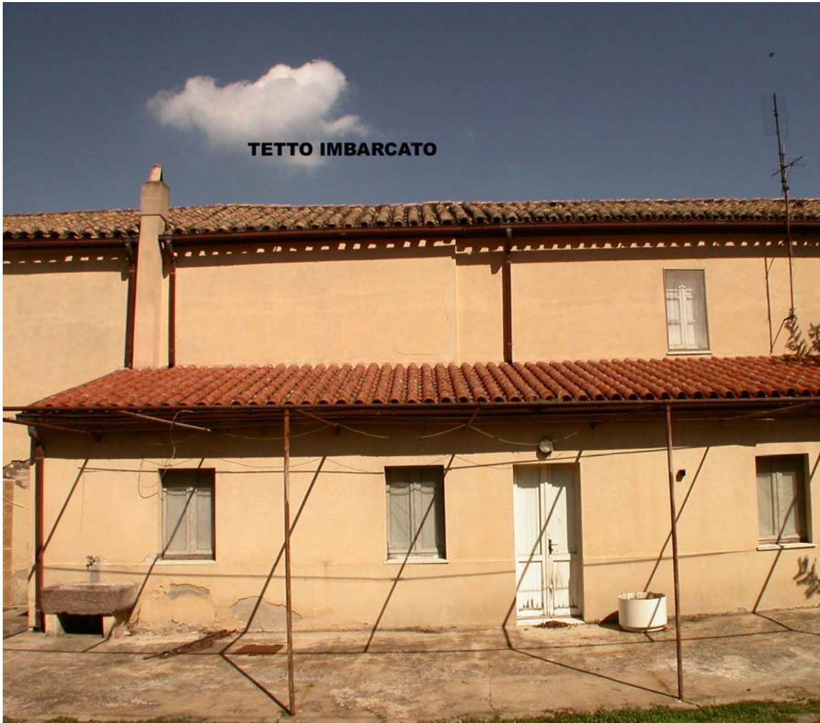
Viste dal Cortile interno. Notare Il colmo del tetto "imbarcato".