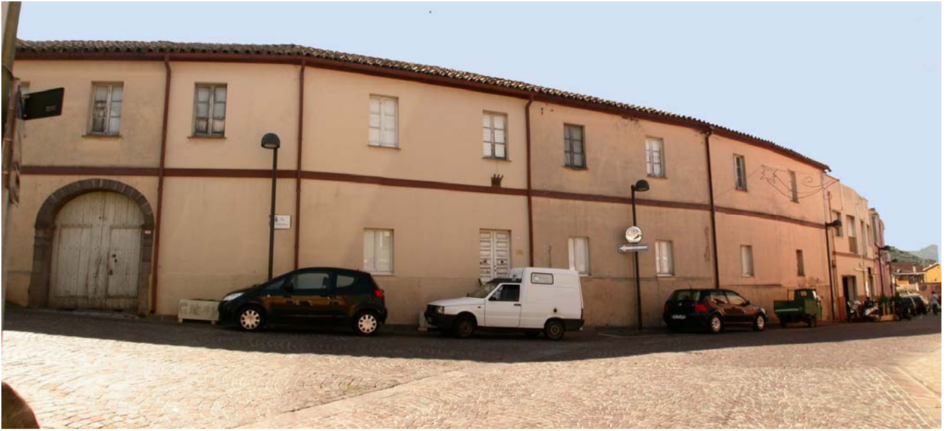
Vista dalla via Siotto