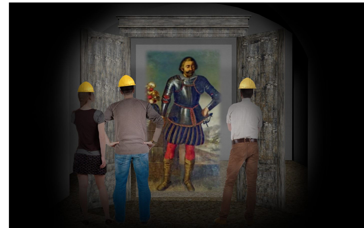
Vista 3D della sala virtuale olografica