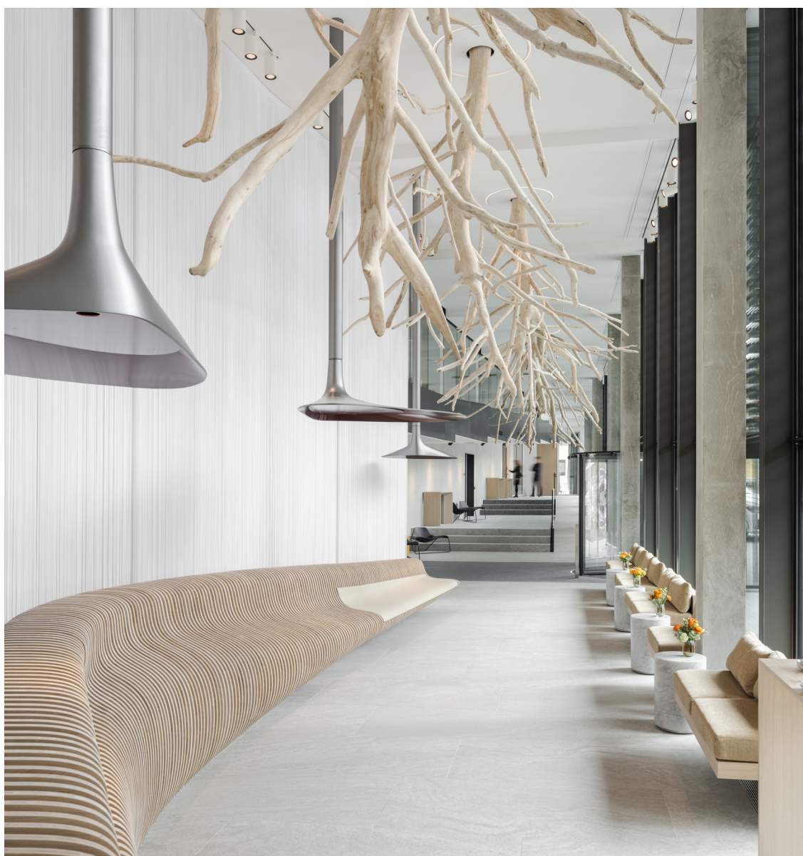
▲ Il design degli interni, progettato dallo studio di architettura AUM, è un tributo ai paesaggi della Vallée de Joux grazie all'utilizzo di materiali locali come il legno e la pietra.

approccio olistico sostenibile, dallo sviluppo dell'edificio fino al suo funzionamento quotidiano, per ridurre l'impatto ambientale. Inoltre, il design degli interni dell'hotel è stato immaginato da AUM come tributo al paesaggio in cui è immerso, mentre i ristoranti affidati allo chef stellato Emmanuel Renaut esaltano gli aromi di ingredienti stagionali e di provenienza locale. Inteso come punto d'incontro per gli appassionati di orologeria, architettura e natura locali e internazionali, questo luogo accogliente incoraggia lo sviluppo del turismo nella Vallée de Joux promuovendo il know-how e il patrimonio della regione.