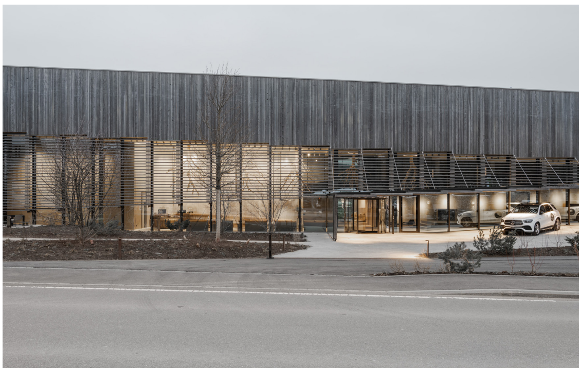
▲ Situato nella stessa location dei suoi predecessori, il nuovo Hôtel des Horlogers continua la lunga storia iniziata nel 1857 con l'Hôtel de France – una tappa importante sullo Chemin des Horlogers che collegava gli atelier della Vallée de Joux a Ginevra.

Dopo quattro anni di lavoro, l'Hôtel des Horlogers è ora pronto a seguire le orme dei suoi predecessori e ad accogliere i nuovi visitatori della Vallée de Joux.