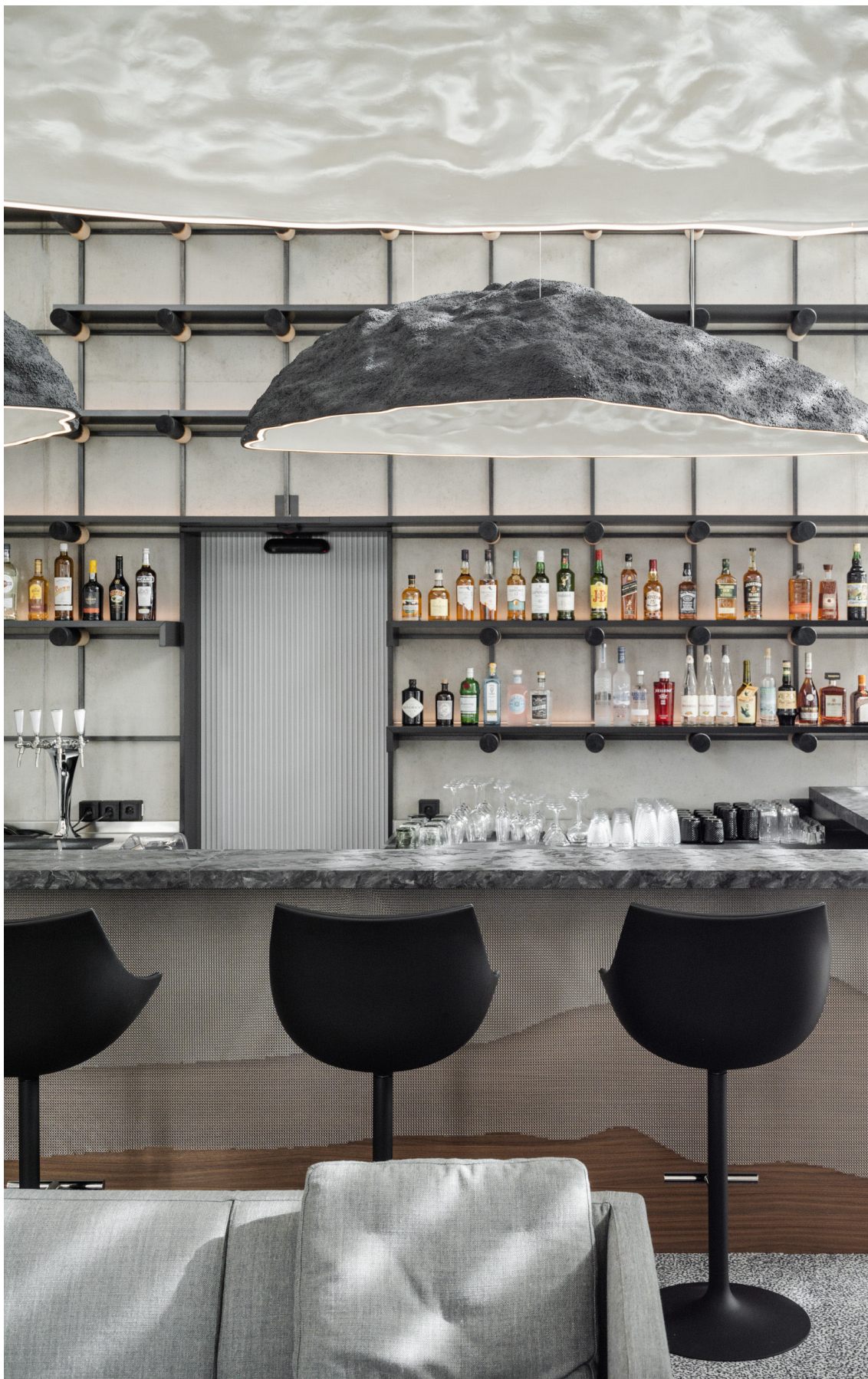
▲ Il Bar des Horlogers accoglie visitatori e abitanti della Vallée in un'atmosfera sotto il segno del relax per gustare bevande e cibo locale.