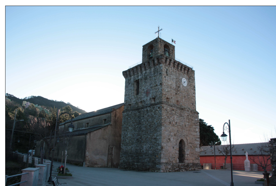
Rapporto con il contesto