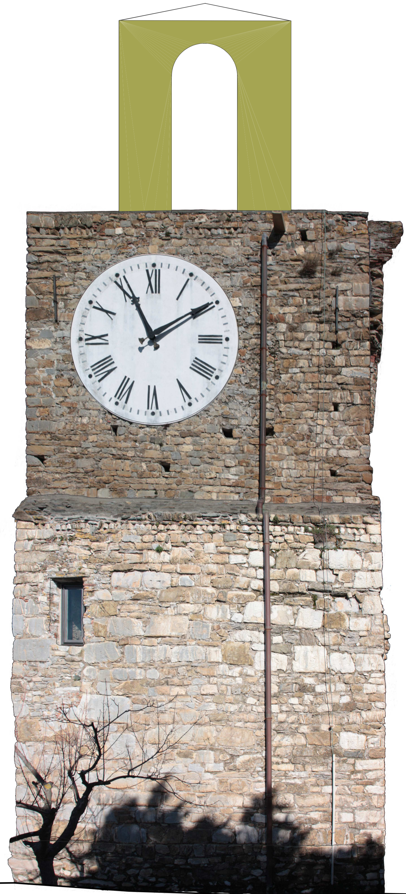
Prospetto Sud Scala 1:50