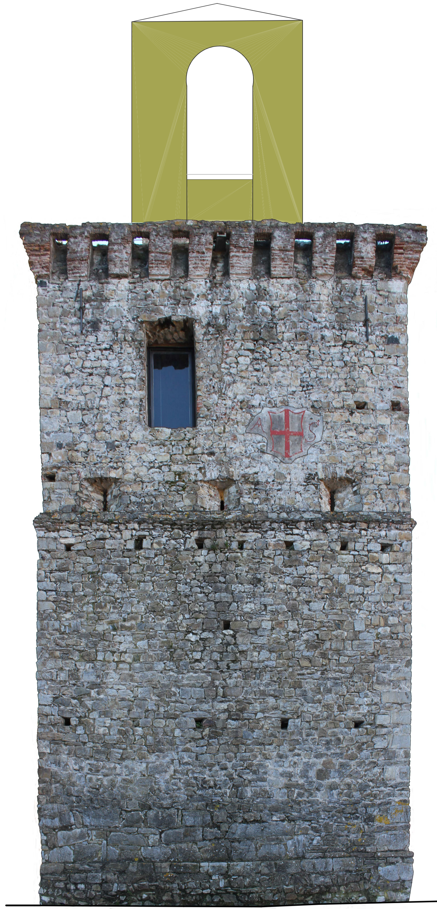
Prospetto Nord Scala 1:50