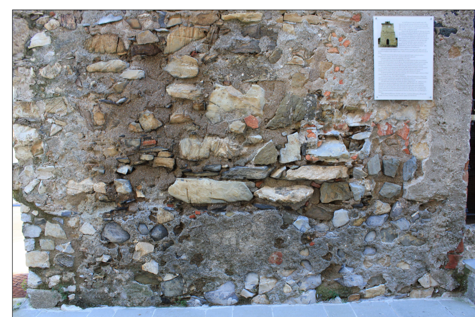
Muratura fortemente rimaneggiata all'entrata della torre