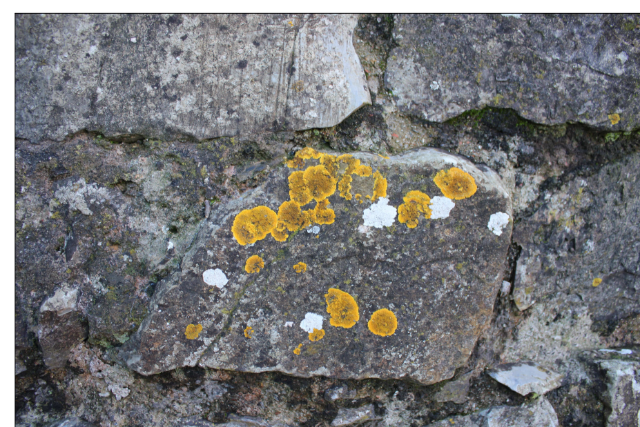
Patina biologica presente sul prospetto nord