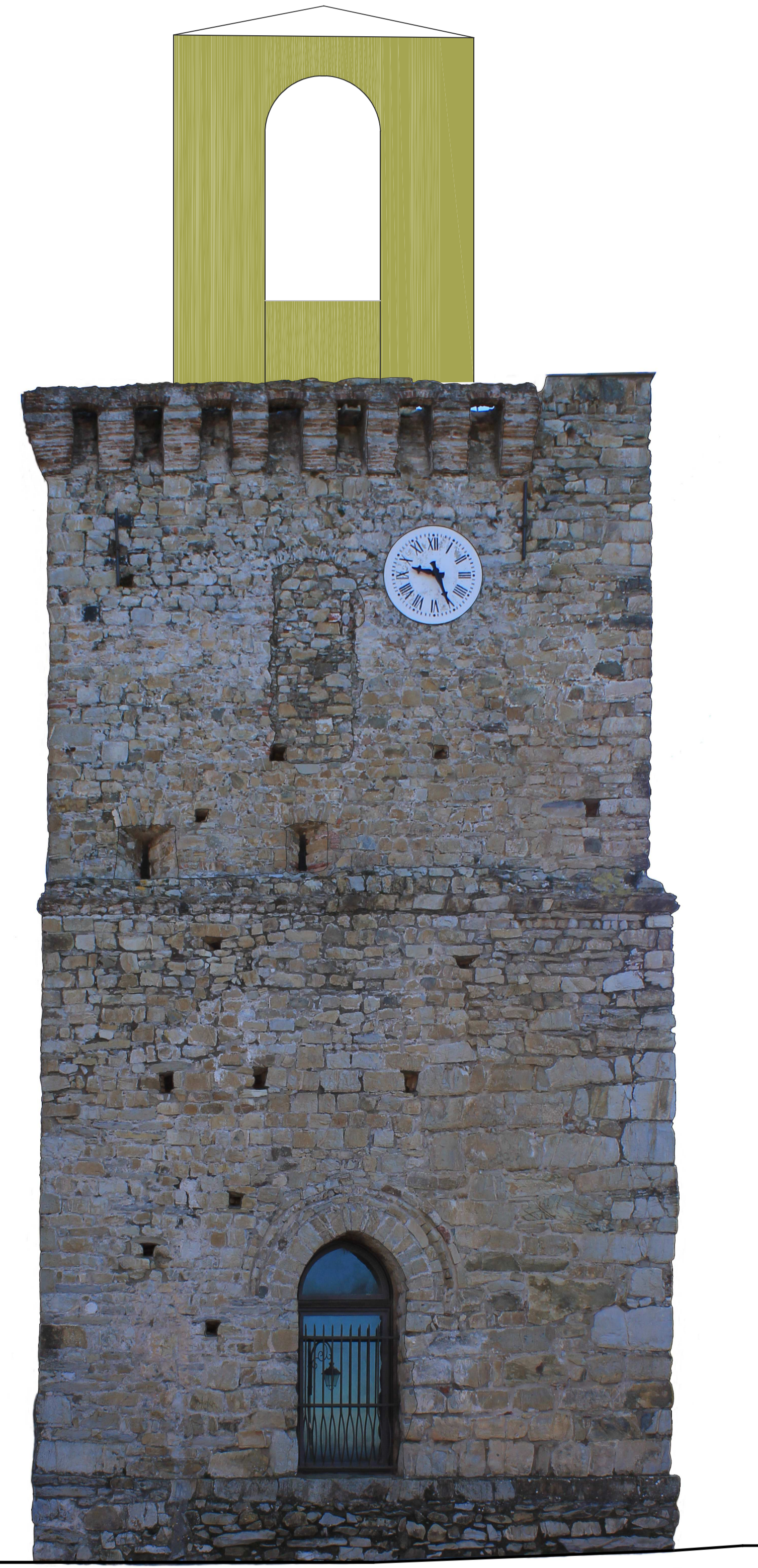
Prospetto Ovest Scala 1:50