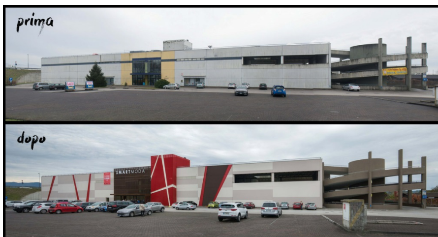
Facciata Nord e ingresso