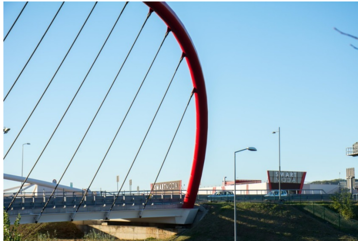
Continuità cromatica con il territorio

Sono stati inseriti dei segni distintivi di colore rosso , proprio della stessa tonalità della vicina rotatoria, identificando una forte continuità formale con il territorio circostante. Nelle fasce rosse è presente una striscia LED che assicura la giusta valorizzazione notturna.