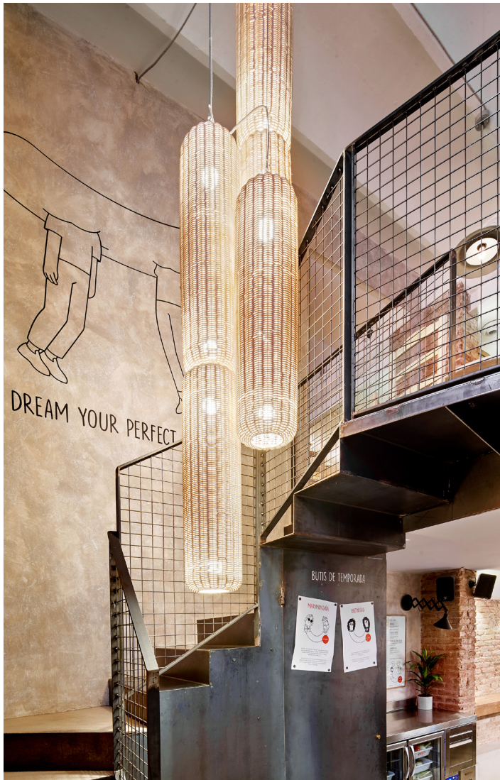
GRÁFICO: Miscellaneous studio