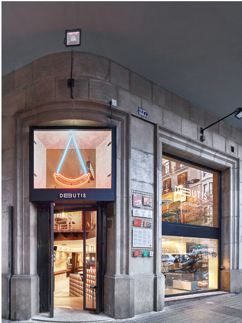
GRÁFICO: Miscellaneous studio