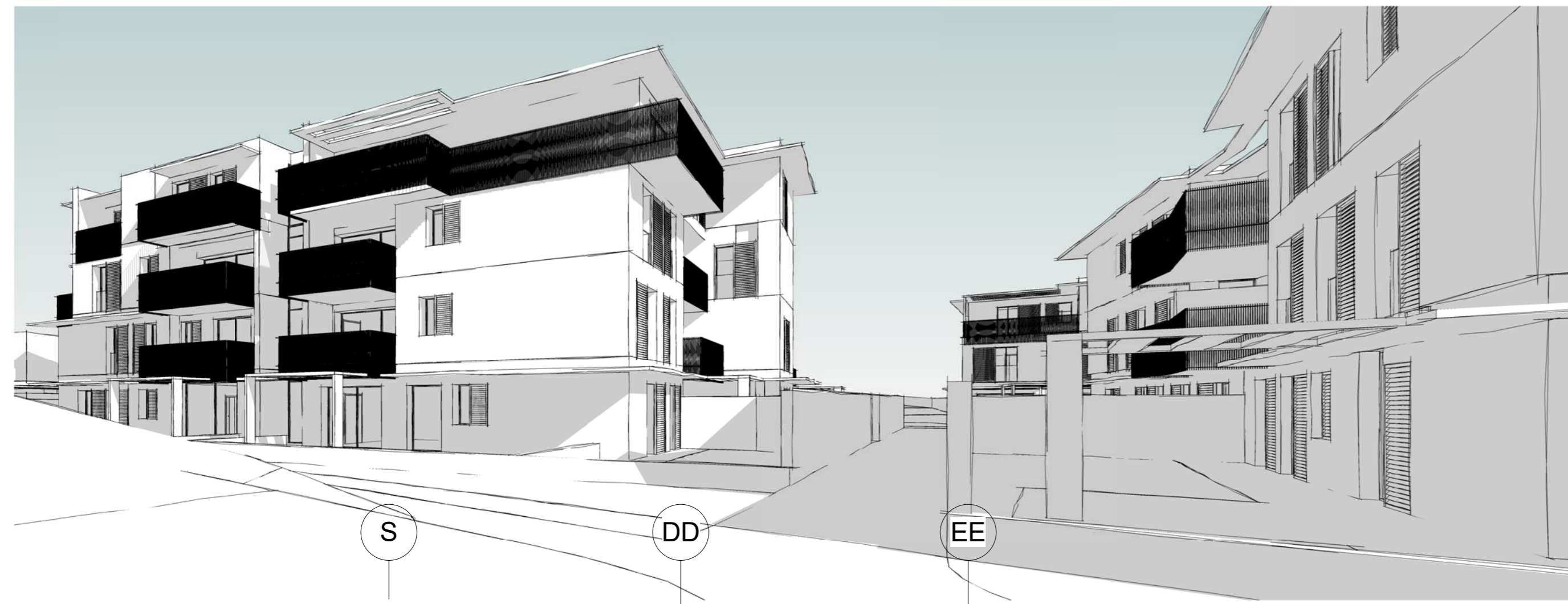
Vista 3D 2 Scala