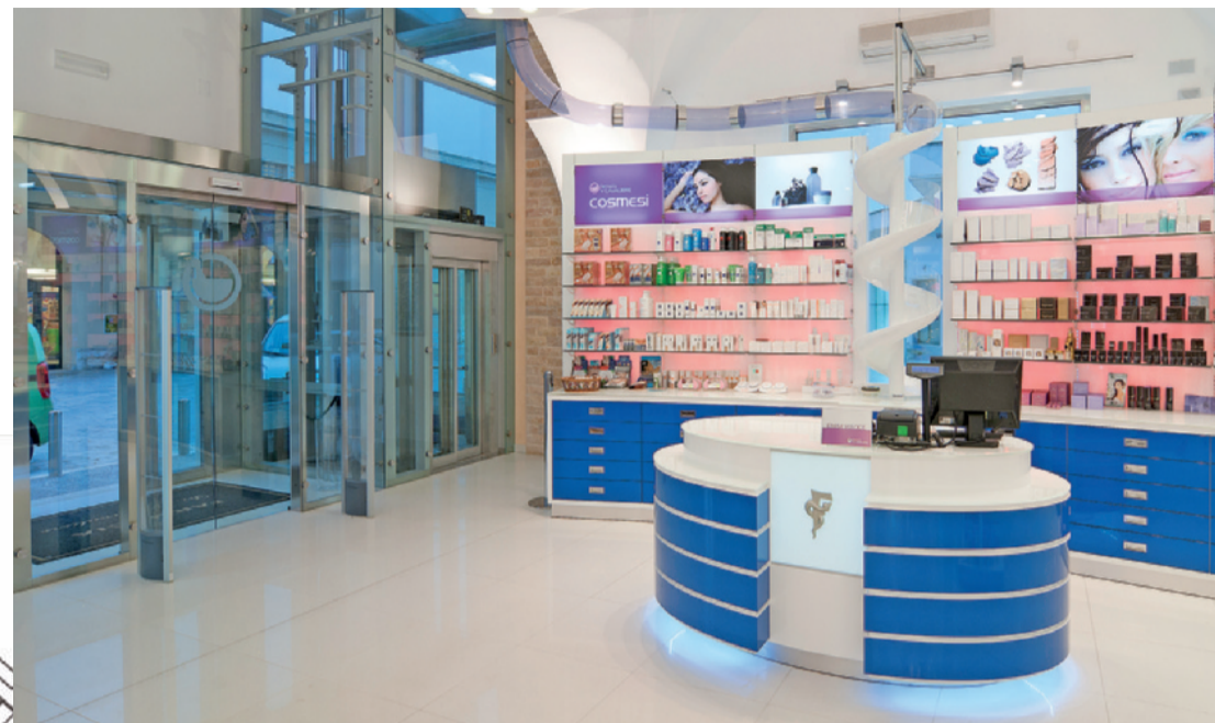
Planimetria: 500 mq disposti su 2 livelli attrezzati con grandi espositori perimetrali e altri disposti nella zona centrale a creare un percorso espositivo coinvolgente e funzionale

sposta all'integrazione con la lettura dei codici a barre. Il farmacista ordina dal computer di banco il farmaco, il sistema lo estrae dal magazzino e, sospingendolo con un getto d'aria attraverso il tunnel, lo fa arrivare direttamente sul bancone attraverso una spirale. Questo, oltre che abbreviare i tempi di evasione della richiesta, evita al farmacista di andare a cercare personalmente il farmaco, permettendogli di dedicare più tempo al cliente, soddisfacendone così le richieste di ascolto e consiglio.