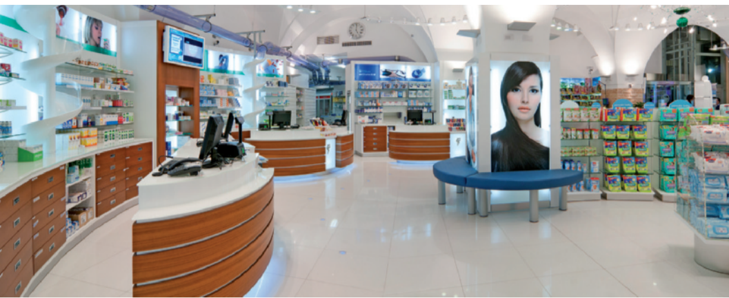
La zona dell'etico ben riconoscibile grazie alla presenza di 3 grandi banconi semiovali realizzati con l'impiego del legno teak