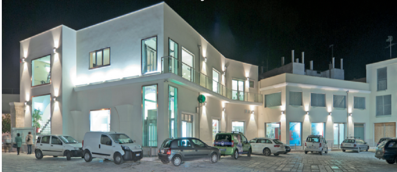
Una vista dell'esterno da cui sono visibili le numerose vetrine della farmacia

consumatore, attraverso forme, colori e scelta dei materiali, si è puntato su un design molto chiaro. L'intento era di ottenere un'atmosfera unica, che allo stesso tempo potesse sorprendere e coinvolgere appieno l'avventore. Punto cardine del progetto è stato quello di assicurarsi la massima visibilità anche del piano superiore adibito ai