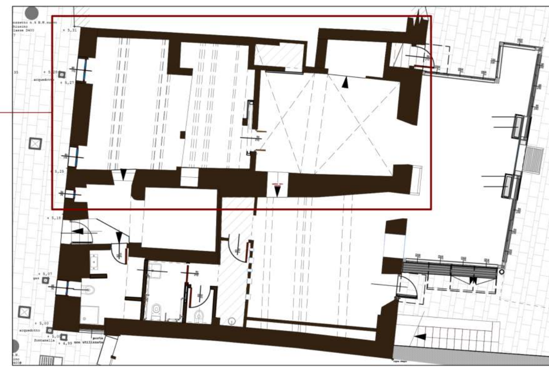
Planimetria di inquadratura