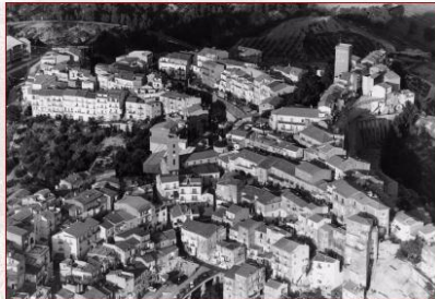
VISTA DEL CENTRO STORICO LATO EST