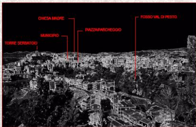
VEDUTA COMPLESSIVA TERRITORIALE DEL COMUNE DI SANT'ARCAANGELO DI POTENZA