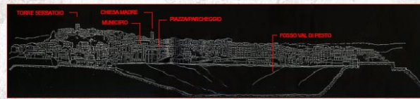
PROFILO COMPLESSIVO TERRITORIALE DEL COMUNE DI SANT'ARCAANGELO DI POTENZA