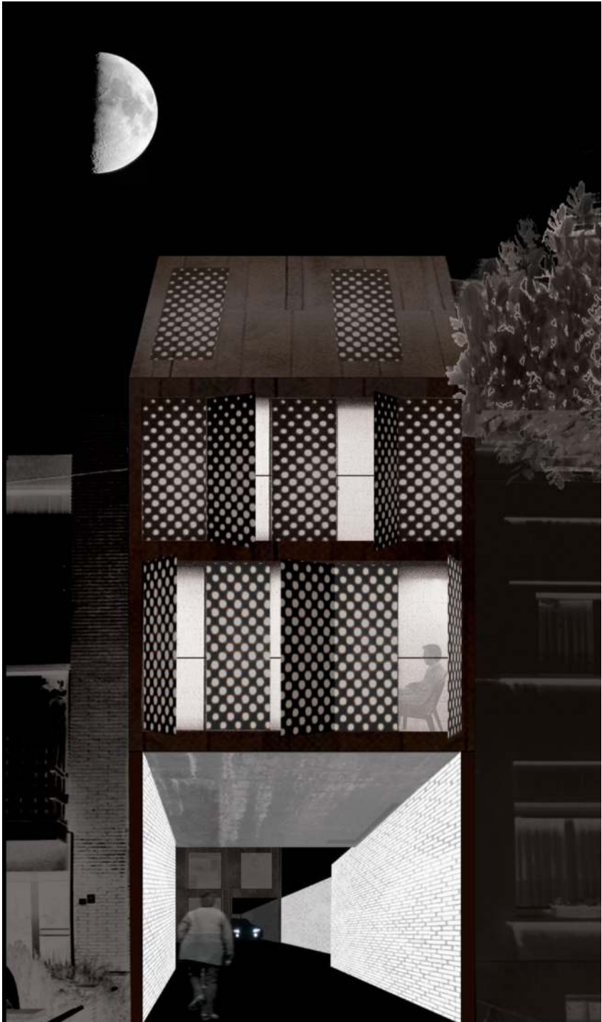
Straatbeeld optie 1