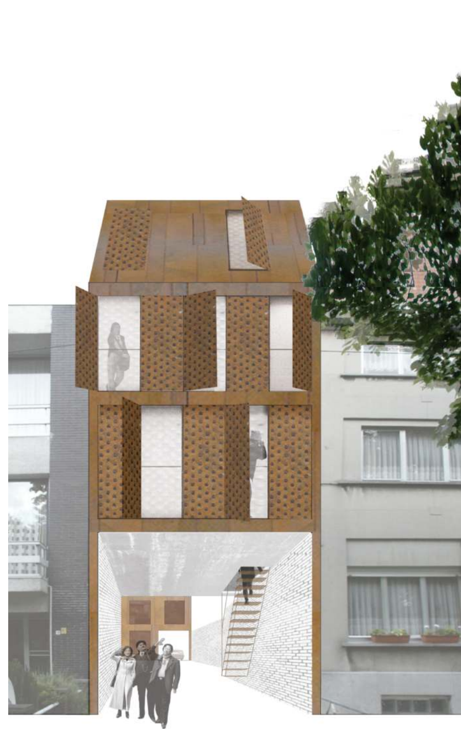
Straatbeeld optie 1