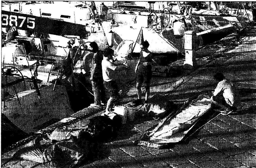
Fervono i preparativi sulla banchina di Santa Margherita per la 37° edizione delle Regate Pirelli